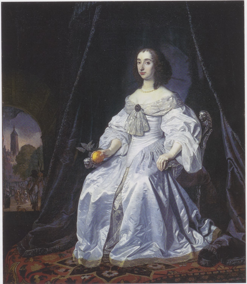
Afb. 5 Verzilverde stoel in kwabstijl op een por- tret van prinses Hen- rietta Maria Stuart door Bartholomeus van der Helst uit 1652. Rijksmuseum, Amsterdam (inv.nr. SK-A-142).

brengen van een nieuwe grondering. Het verwijderen van dergelijke ingrepen zou in de toekomst tot te veel schade leiden. Uiteindelijk is ervoor gekozen om de lijst niet van een nieuwe vergulding te voorzien maar als het ware het huidige aanzien te handhaven. Restauratie van de bestaande bruine afwerking vergde echter nog de nodige aandacht, want de notenbruine beitsing was door slijtage, verbleken en door het verschralen van de beschermende waslaag zeer ongelijkmatig geworden. Bij de restauratie van het uiterlijk vormde het een uitdaging om ondanks uitgebreid retoucheren toch voldoende transparantie te behouden, zodat het hout nog als hout beleeft