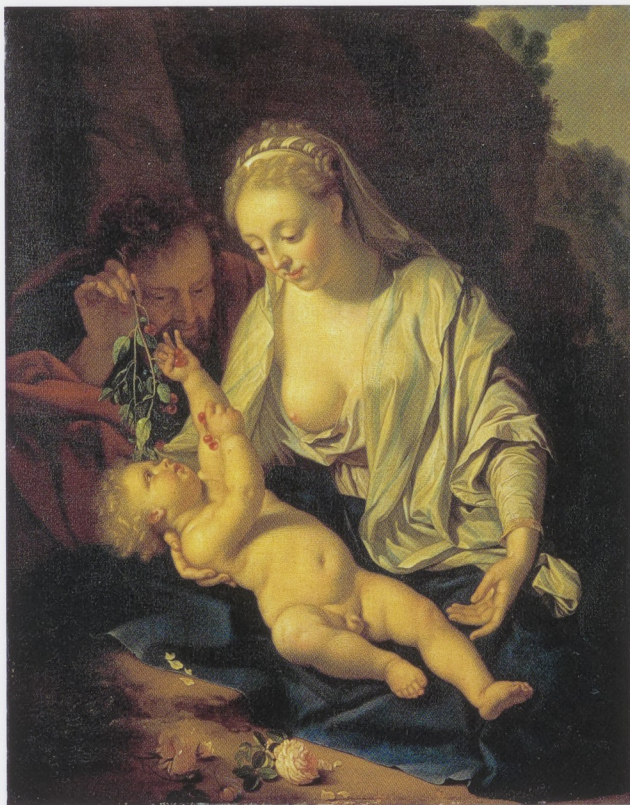
Afb. 3 ADRIAEN VAN DER WERFF, De Heilige Familie , 1714. Rijksmuseum in bruikleen aan Museum Amstelkring, Amsterdam.