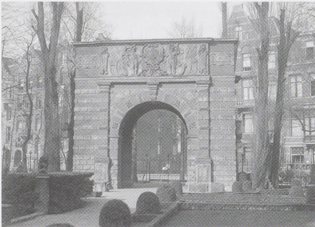
Afb. 9 De Buiten-Bergpoort in de tuin van het Rijksmuseum