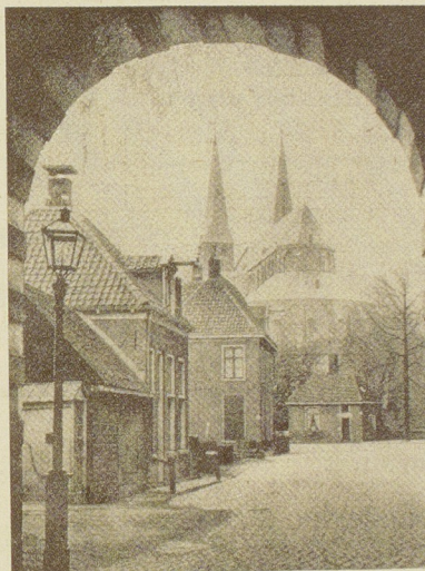
★ Gezicht van de Buiten-Bergpoort op het Bergschild.