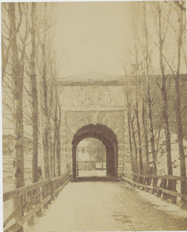
Afb. 4 Front van de Buiten- Bergpoort in situ .