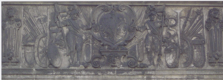
Afb. 3 Detail van het fries van de Buiten-Berg- poort.