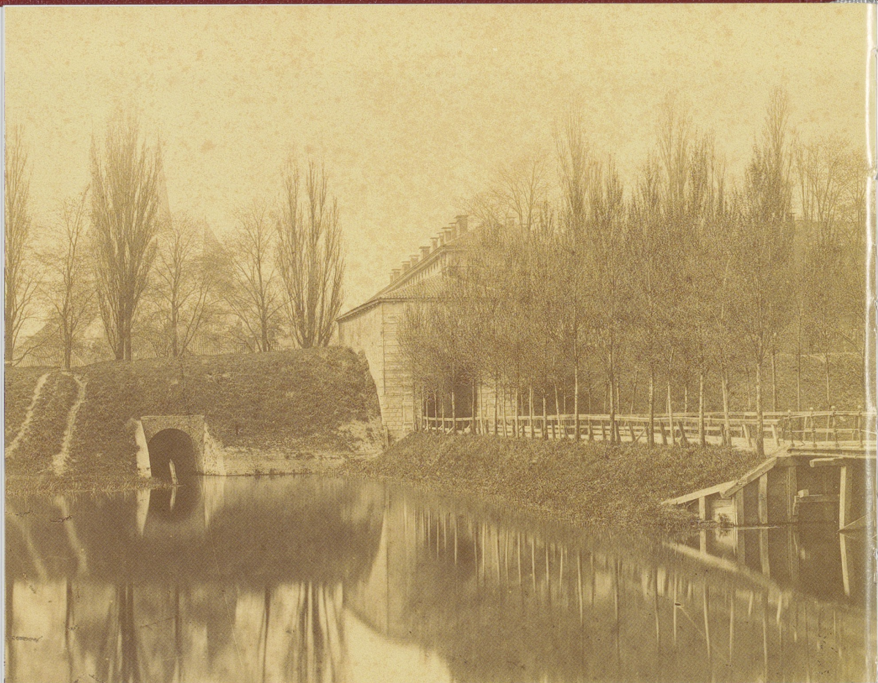
Afb. 2 De Buiten-Bergpoort ingebod in de stadsomwalling van Deventer. Stadsarchief en Athenaeum- bibliotheek, Deventer. Foto M. Bosse.

nieuwde verdedigingswerken werden gebouwd, waren lage, overwelfde, sluitbare doorgangen in de brede aarden wallen (afb. 2). Grote poortgebouwen bleken in het geval van beschietingen namelijk meer gevaar dan nut op te leveren. 3 In de meeste gevallen kregen de poorten aan de buitenzijde een uitgebreid sierfront in de trant van antieke triomfbogen; de twee in de tuin van het Rijksmuseum zijn hier goede voorbeelden van.