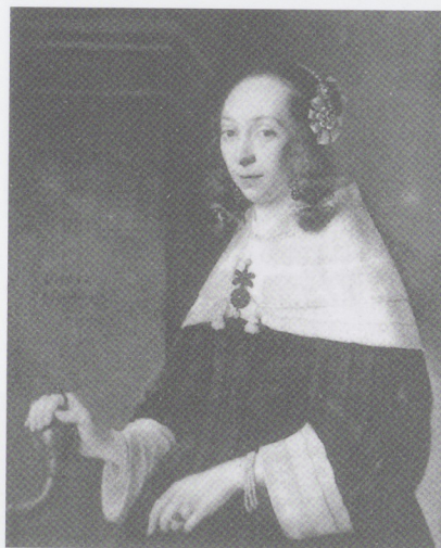
Afb. 8 ANTHONIE PALAMEDESZ, Portret van een jonge vrouw, mogelijk een lid van de familie Van Bronckhorst, 1652. Doek, 83 x 67 cm. Ver- blijfplaats onbekend.

1613) moet zijn geboren. 11 Bij het portret van de jonge vrouw uit 1652 (afb. 8) hebben we wellicht, maar dit is uiteraard slechts hypothetisch, te maken met een van de dochters van dit echtpaar 12 of wellicht met de eerste vrouw van Anthonij van Bronckhorst, Dorothea Gaels, met wie hij in mei 1652 in het huwelijk trad en die al voor 1659 was overleden.