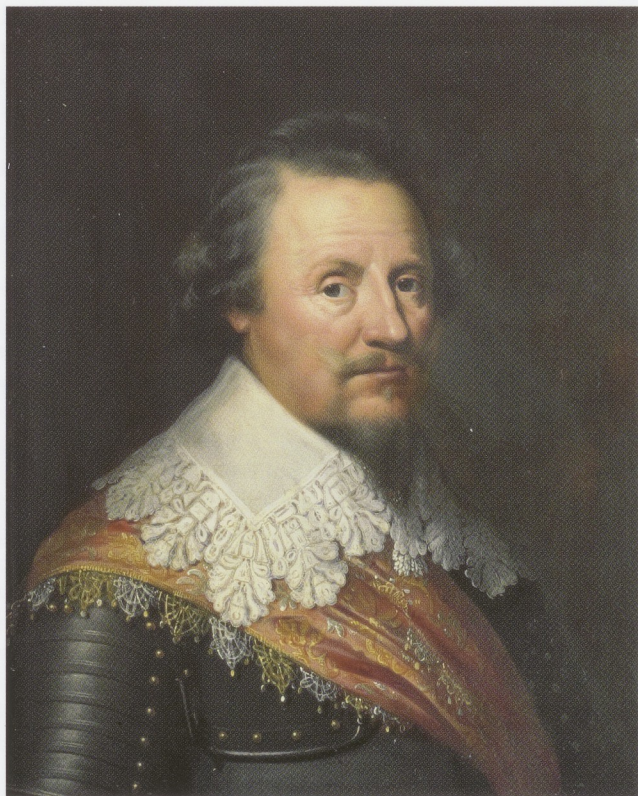
Afb. 9 WYBRAND DE GEEST, Portret van Ernst Casimir, graaf van Nassau-Dietz , 1633. Paneel, 66,8 x 58 cm. Rijksmuseum, Amsterdam (inv.nr. SK-A-571).