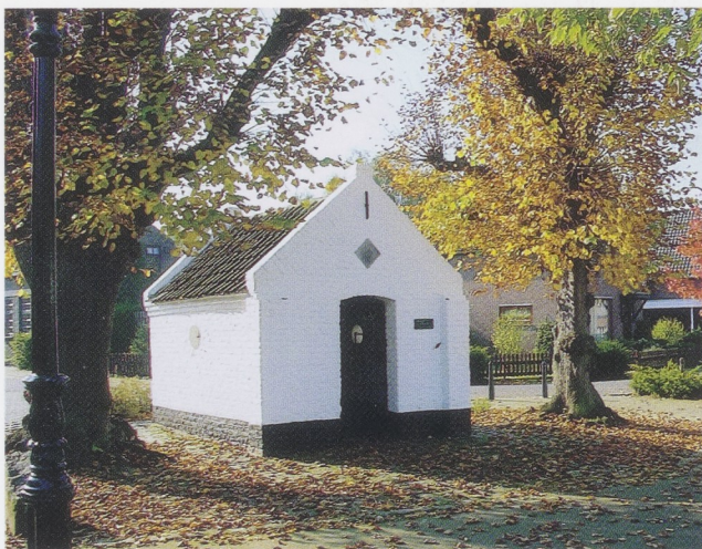
Afb. 2 Wegkapelletje in Boekoel, waar de Bewening tot 1933 heeft gestaan.

stig is uit het kartuizerklooster in Roermond dat in 1795 onder de Franse bezetting werd opgeheven. Vandaar zou het gemakkelijk in het nabijgelegen Boekoel kunnen zijn terechtgekomen. Een soortgelijke Bewening van dezelfde maker en eveneens met een knielende kartuizer belandde in 1861 in Musée de Cluny in Parijs. Beide werken waren waarschijnlijk gemaakt voor de privé-devotie van de monniken.