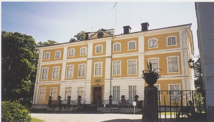
Afb. 2 Het huis Julita in 2003.

(afb. 2). Ook treffen we hier een simpele, vrijwel uitgestorven jeugdherberg aan, waardoor we 's avonds het hele terrein bijna voor ons zelf lijken te hebben. Onder de museumgidsen verspreidt het nieuws zich ondertussen snel dat een conservator van het Amsterdamse Rijksmuseum in Julita is, want het schilderij van Allart van Everdingen (die naam spreken de gidsen probleemloos uit) heeft hier grote faam en kent men tot in detail – geen wonder, want tot mijn verrassing hangt in een van de kamers van het landhuis een even grote kopie te pronken (afb. 3). Zo wordt dat industriële verleden hier te midden van het agrarische heden toch gekoesterd.