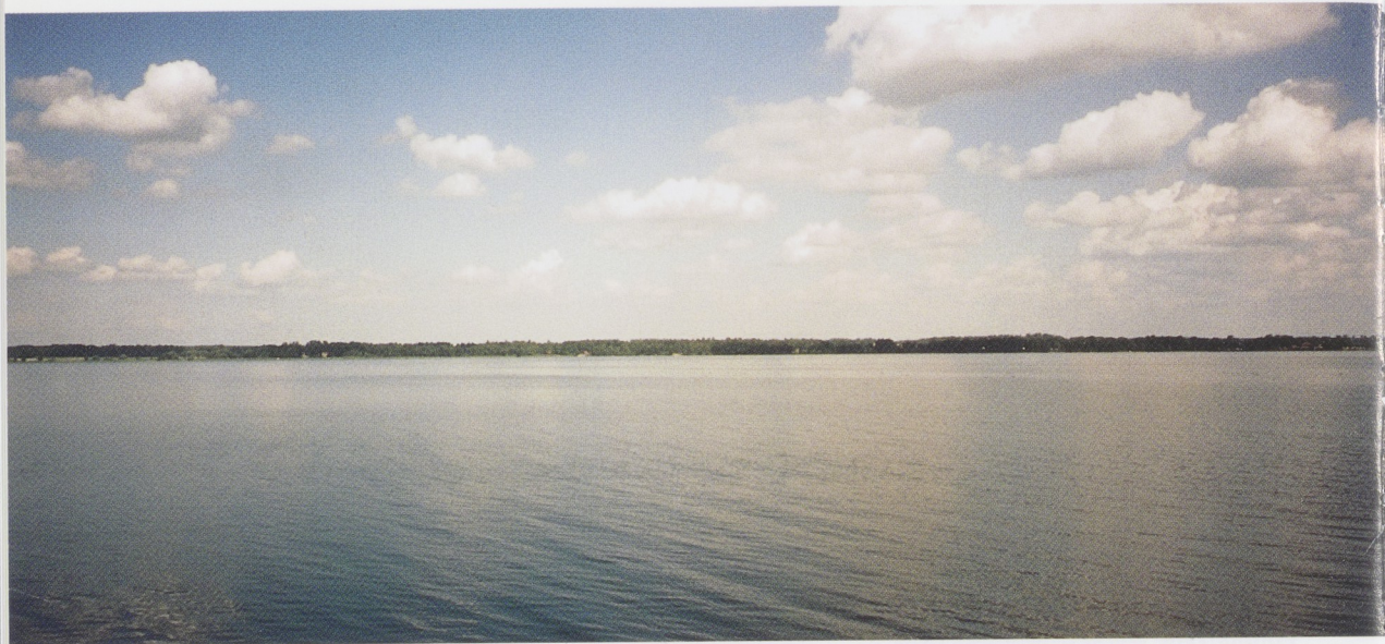
Afb. 4 Julita en omgeving gezien vanaf de over- kant van het meer Oljären.