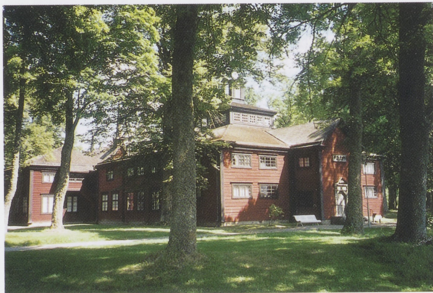
Afb. 5 Het museumgebouw op het terrein van Julita.