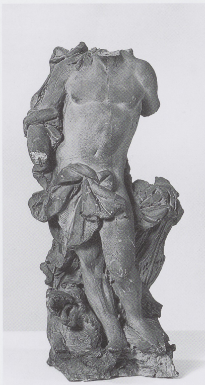
Afb. 6 IGNATIUS VAN LOGTEREN, Diana , circa 1725, terracotta, h. 32,5 cm, Rijks- museum, Amsterdam (inv.nr. BK-1997-21), foto Lichtbeelden- instituut.