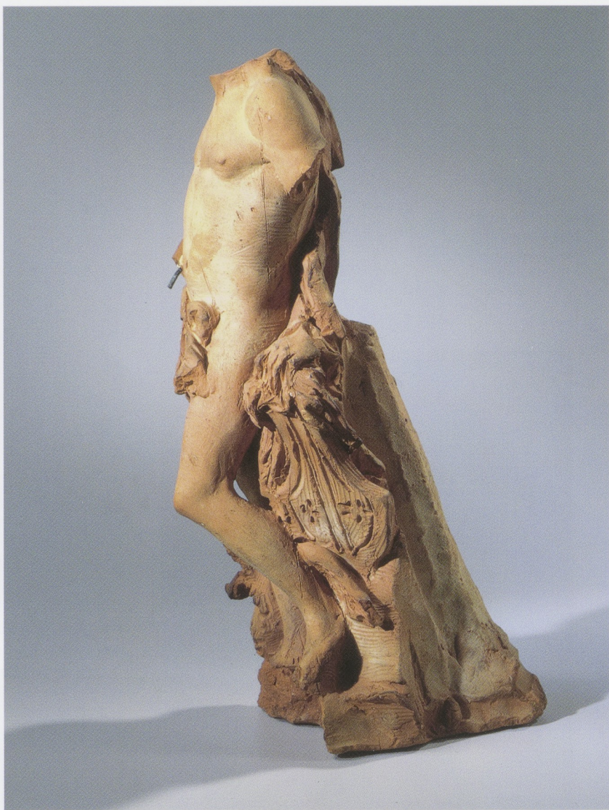
Afb. 15 IGNATIUS VAN LOGTEREN, Apollo (zijaanzicht), circa 1725, terracotta, h. 32 cm, Rijks- museum, Amsterdam (inv.nr. BK-1997-20).

den de beeldhouwer bij zijn werk. Ze geven een bepaalde maatvoering op schaal aan, die hem eveneens ten dienste stond bij de transformatie van klein naar groot. Zulke schaalverdelingen komen op bozzetti en modelli geregeld voor. 14 De meetpunten op het Diana- bozzetto lijken te staan voor voet- en duimmaten. De breedte van de plint van Diana is aangegeven door twee verticale lijntjes op de hoeken met een tussenmaat van 9 cm. In het