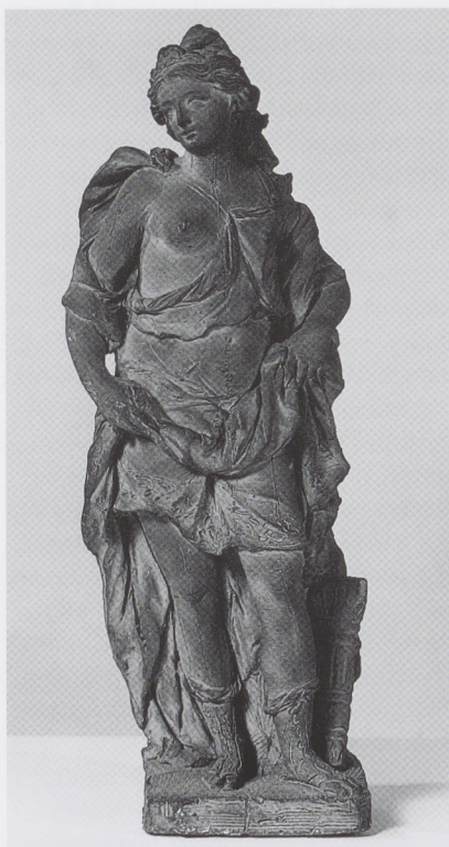
Afb. 7 IGNATIUS VAN LOGTEREN, Atalanta , circa 1725, terracotta, verblijfplaats onbekend, foto Lichtbeeldeninstituut.

Op een kleine foto uit circa 1950 (Amsterdams Gemeentearchief) zijn de twee terracotta's van de Academie te zien samen met een derde exemplaar, een Atalanta, dat helaas verdwenen is, maar dat overduidelijk van dezelfde hand is en tot het ensemble heeft behoord (afb. 4). Bovendien is