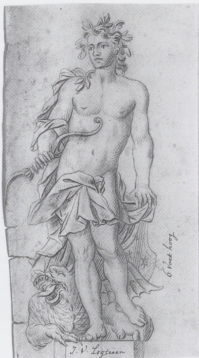
Afb. 9 JAN VAN LOGTEREN, Apollo , circa 1725, tekening in potlood en pen, part. collectie, Amsterdam.

tekeningen – evenals de terracotta ontwerpen, gezien hun samenhang in stijl – afkomstig zijn uit dat atelier. 7 Toch is daarmee de toeschrijving van de terracotta's niet opgelost, want de naam op de tekeningen kan zich laten lezen als die van Ignatius of van Jan van Logteren, omdat het onderscheid tussen de I en J in kapitaal niet werd gemaakt in 18de-eeuws schrift. Bovendien werkte Jan van Logteren na de dood van zijn vader in 1732 in diens stijl door, waarbij hij gebruik maakte van diens artistieke erfenis. Modellen voor beelden die in Ignatius' atelier achterbleven na zijn dood konden moeiteloos door zijn zoon worden (her-)gebruikt. Een advertentie die Jan in 1742 in de Amsterdamsche Courant plaatste, waarin de verkoop werd aangekondigd van beelden uit Jans bezit, bevestigt die gang van zaken: Jan van der Streng Makelaar, zal op Dingsdag 10 April, 's morgens ten 9 uuren ten huize van Jan van Logteren, Beeldhouwer op de Prinsegragt over de Amstelkerk, verkopen