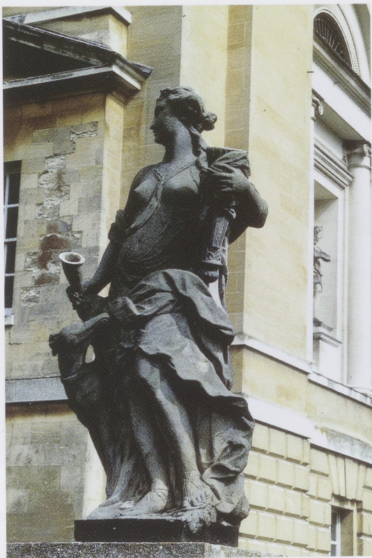
Afb. 14 IGNATIUS VAN LOGTEREN, Diana , circa 1725, Bentheimer zand- steen, h. circa 180 cm, Woburn Abbey.

Een grote zandstenen Diana, gesig-neerd met Ignatius' monogram I.V.L., bevindt zich op Woburn Abbey, het landgoed van de hertogen van Bedford (afb. 14). Dit beeld vertoont evidente overeenkomsten met de terracotta Diana, vooral door de houding en plaatsing van de hazewindhond aan de voeten van de godin en haar draperie. Hoewel niet sprake is van hetzelfde model, overtuigen de overeenkomsten