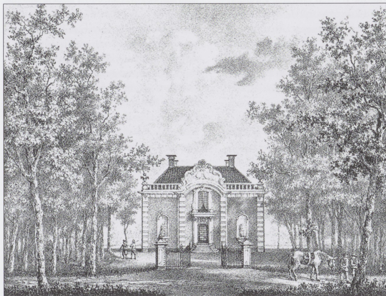
Afb. 13 P.J. RUTGERS, Vecht- vlriet te Breukelen , lithografie uit: Gezigten aan de rivier de Vecht [...] , Utrecht 1836.