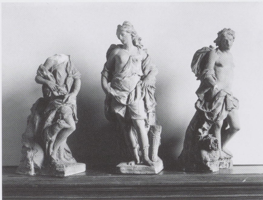
Afb. 4 Ignatius van Logterens Apollo, Diana en Atalanta, op een foto uit circa 1950.