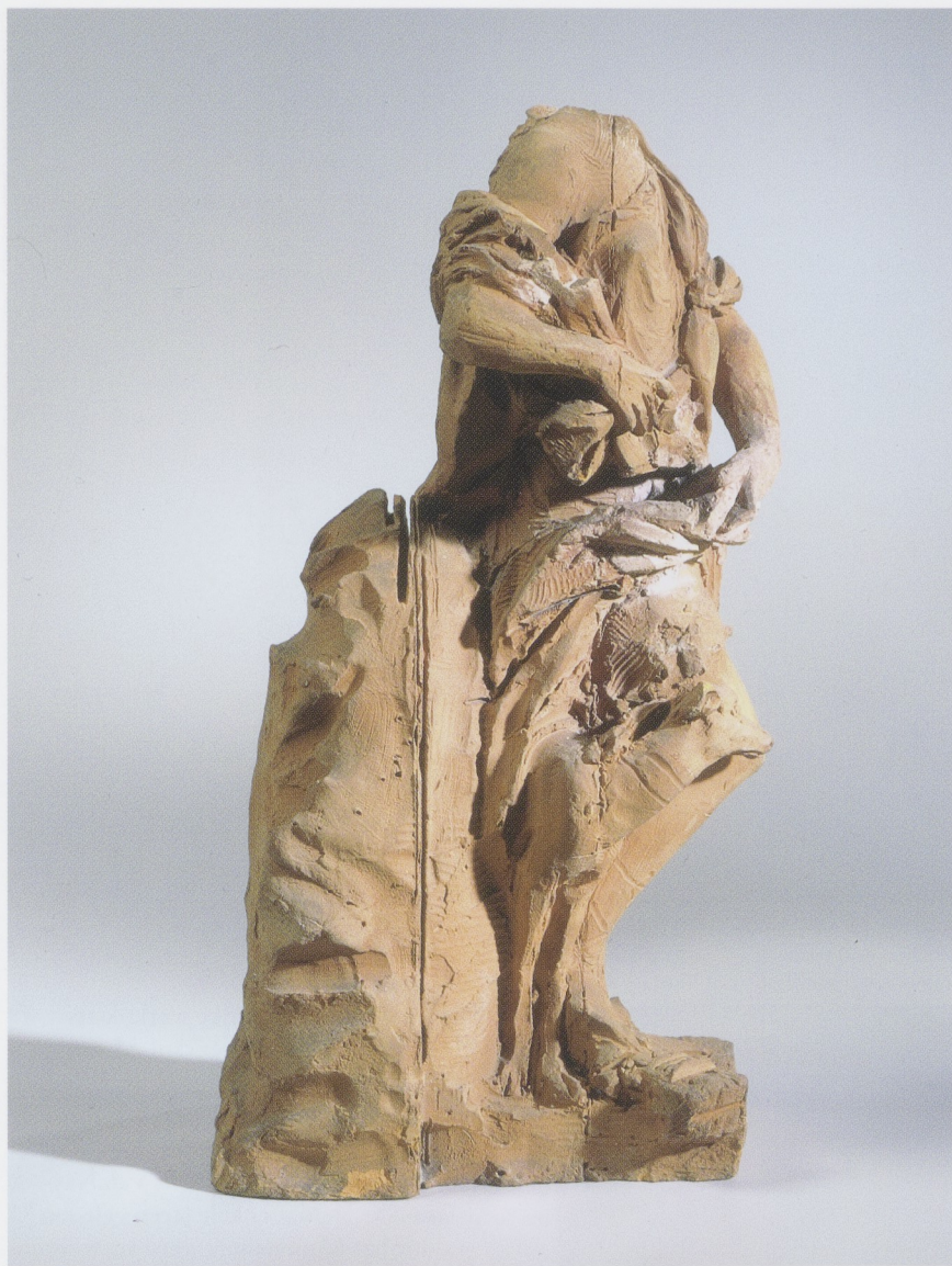
Afb. 16 IGNATIUS VAN LOGTEREN, Diana (zijaanzicht), circa 1725, terracotta, h. 32,5 cm, Rijks- museum, Amsterdam (inv.nr. BK-1997-21).

De twee kleine inkervingen op het bozzetto met een tussenmaat van 0,8 cm komen dan overeen met 1,5 duim.