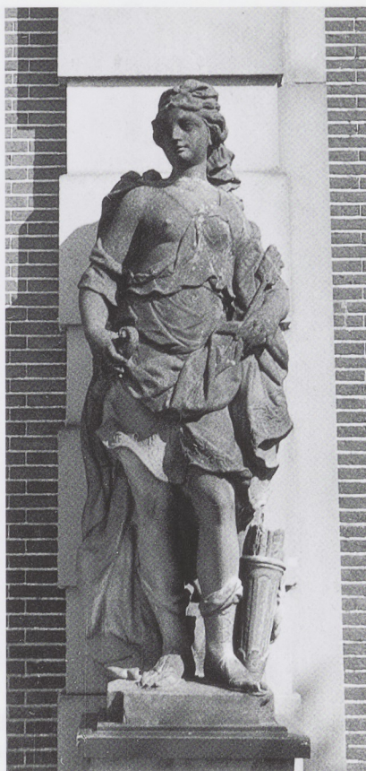
Afb. 12 IGNATIUS VAN LOGTEREN, Atalanta , circa 1725, Bentheimer zandsteen, h. circa 180 cm, Vechtvlriet, Breukelen.