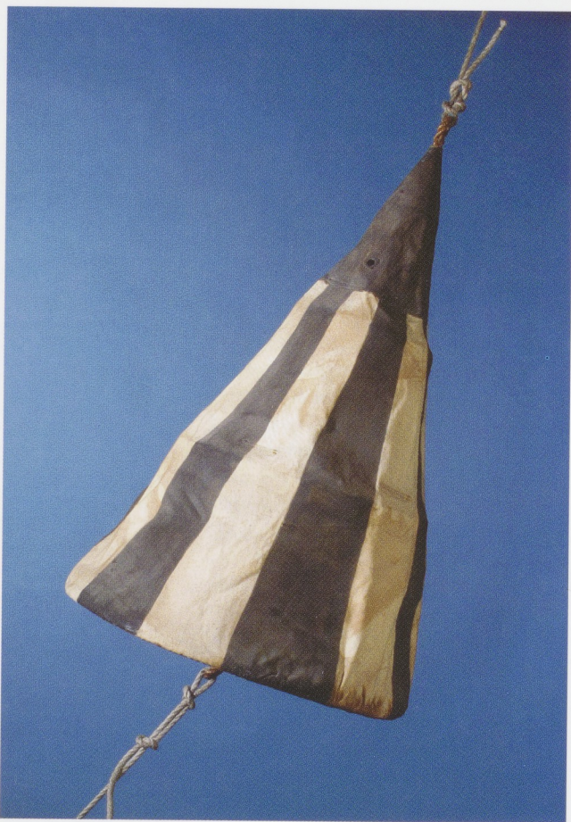
Afb. 2 Seinkegel van de NOT, 1914. Linnen, zwart-wit gestreept, 80 x 55 cm. Neder- lands Scheepvaart- museum, Amsterdam.

vergissingen en verschrijvingen die daar een logisch gevolg van waren, resulteerden in een gestage stroom vragen, verzoeken, klachten en eisen die in lang niet alle gevallen afdoende verwerkt konden worden. Pas in de zomer van 1915 had men de slag te pakken en nam het aantal klachten af.