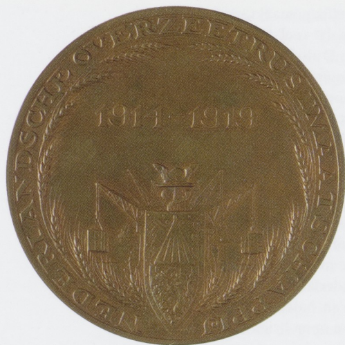
Afb. 5 JOHANNES CORNELIUS WIENECKE, Penning ter gelegenheid van de opheffing van de NOT, 1919. Keerzijde: onder de NOT-kegel een wapenschild met Nederlandse leeuw, met ter weerszijden kranen die goederen ophijzen, en rondom korenaren met opschrift. Brons, diam. 6,5 cm. Rijksmuseum, Amsterdam (inv.nr. NG-2004-90).

landse regering vanaf dat moment daarom steeds meer taken van de NOT over te nemen. Op 3 juli 1918 werd de NOT zelfs helemaal buitenspel gezet toen de Nederlandse regering liet weten onderhandelingen over economische aangelegenheden met buitenlandse autoriteiten voortaan zelf te zullen voeren. De laatste vier maanden van de oorlog hield de NOT zich alleen nog bezig met lopende zaken.