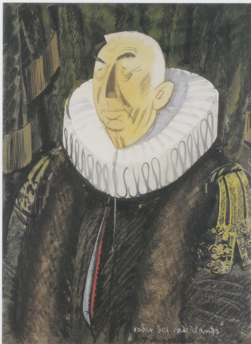
Afb. 6 Piet van der Hem, Vader des Vaderlands , wellicht 1933. Aquarel op papier, 47,8 x 35,5 cm. Rijksmu- seum, Amsterdam.