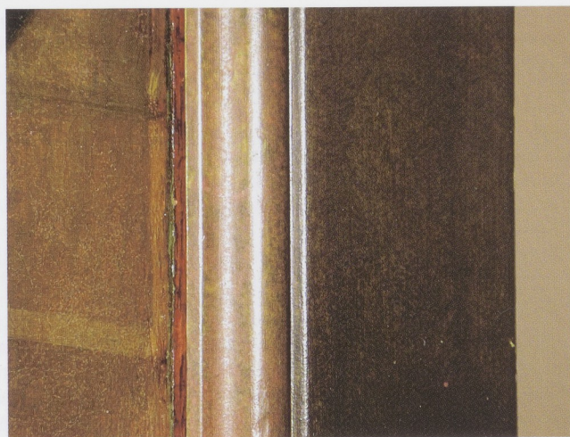
Afb. 1 Macro-opname van de oorspronkelijke groene verf op de baard van het schil- derij.