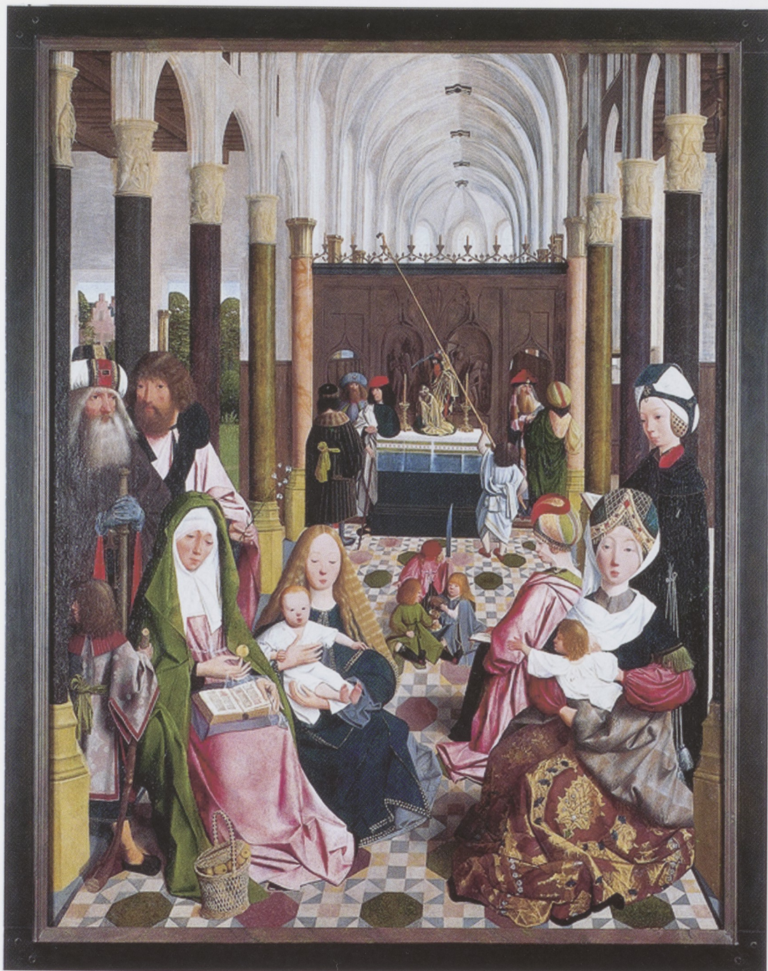
Afb. 9 De Heilige Maagschap in de nieuwe lijst, 2001 (inv.nr. SK-L-3000).