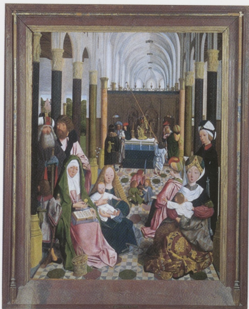
Afb. 3 De Heilige Maagschap in een 19de-eeuwse, neogotische lijst ontworpen door P.J.H. Cuypers (inv.nr. SK-L-3015).