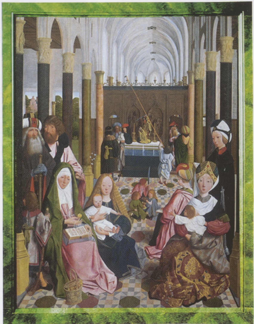
Afb. 8 De Heilige Maagschap in een groene lijst, een tussenfase in de afwerking van de huidige lijst (afb. 9).

Het schilderij is zodanig in de open sponning bevestigd dat het hout kan blijven 'werken' zonder gevaar voor splijten. Met de nieuwe omlijsting (afb. 9) heeft het schilderij een eenvoudige en passende context gekregen en wordt het subtiële, prachtig geres-taureerde schilderij niet meer door de lijst overschaduwd, zoals dat wel het geval was bij de vroegere, vrij bombastische, neogotische lijsten.