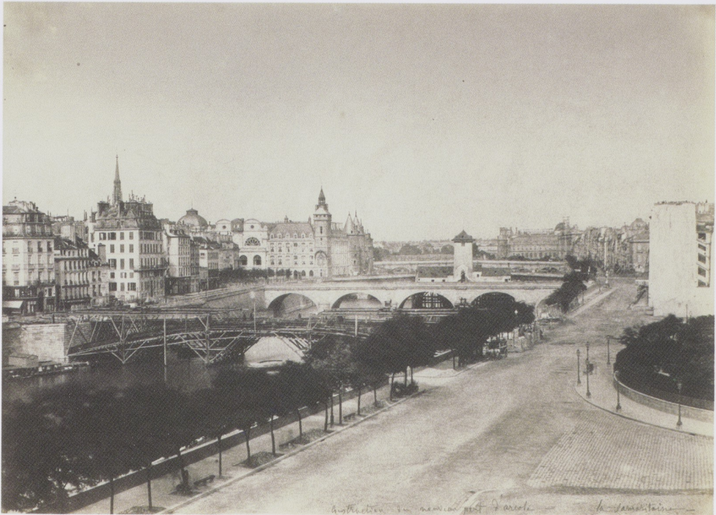
collectie van mevrouw met G. van de - de J. van de -