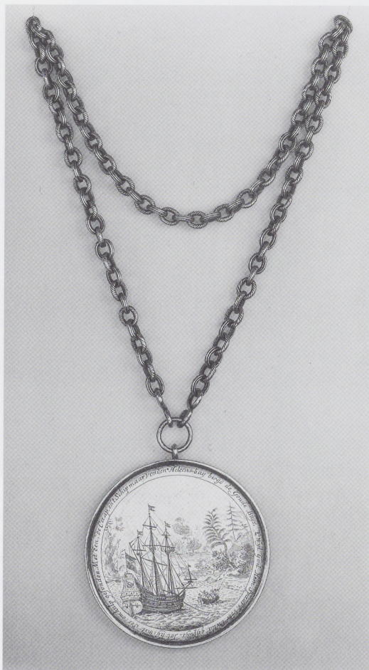
Afb. 4 Zilveren penning en bijbehorende ketting. Rijksmuseum (NG-VG-I-4373).