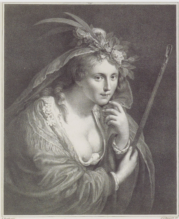
Afb. 5 P. J. MOREELSE, De schone herderin. Doek, 830 x 670 mm. Rijksmuseum, Amsterdam, inv.nr. SK-A-276.

1638), dat zich sinds 1817 in de collectie van het Rijksmuseum bevindt, bestond in de 19de eeuw grote waardeering. Het werd vele malen gekopieerd. 16