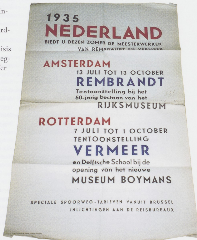
Afb. 7 Anoniem, Affiche Rembrandt-tentoon- stelling, Rijksmuseum, 13 juli tot 13 oktober en Vermeertentoonstelling, Museum Boymans, 7 juli tot 1 oktober 1935. Machinale druk, 100 x 62 cm. Museum Enschedé, Haarlem.

De tentoonstelling trok het recordaantal van 126.000 bezoekers. Ondanks de heersende wereldwijde crisis waardoor buitenlanders massaal wegbleven, kwam het totale bezoekerscijfer van het Rijksmuseum in 1935 zodoende nog op ruim 242.000. 33