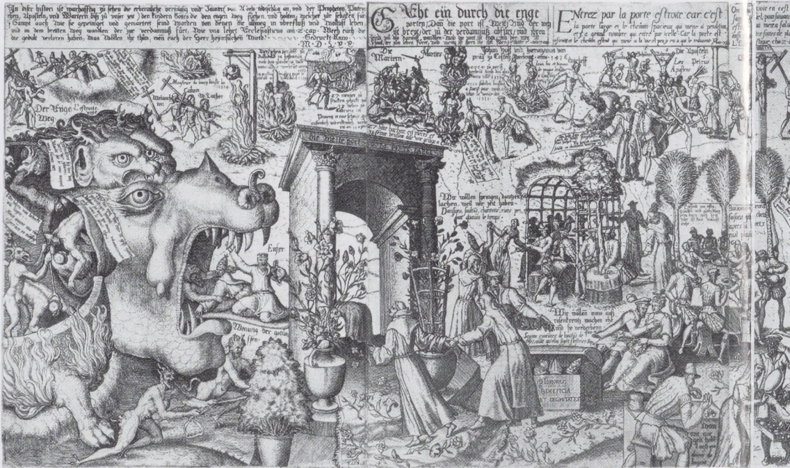
Afb. 5. Als afb. 1, tweede blad.