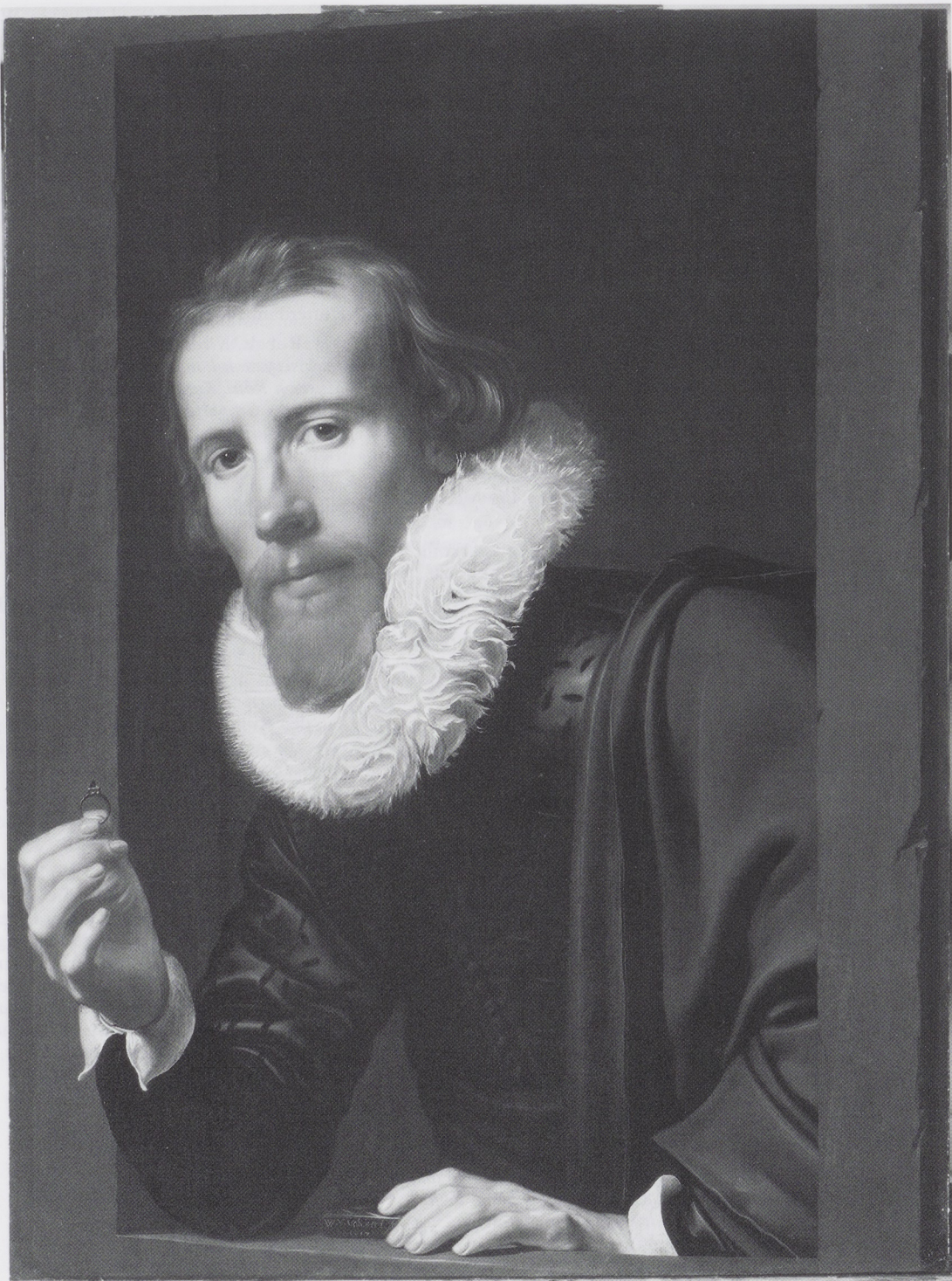
Afb. 1. Werner van den Valckert, Bartholomeus Jansz. van Assendelft, 1617. Paneel, 65 x 49,5 cm. Rijksmuseum, Amsterdam. (SK-A-3920)