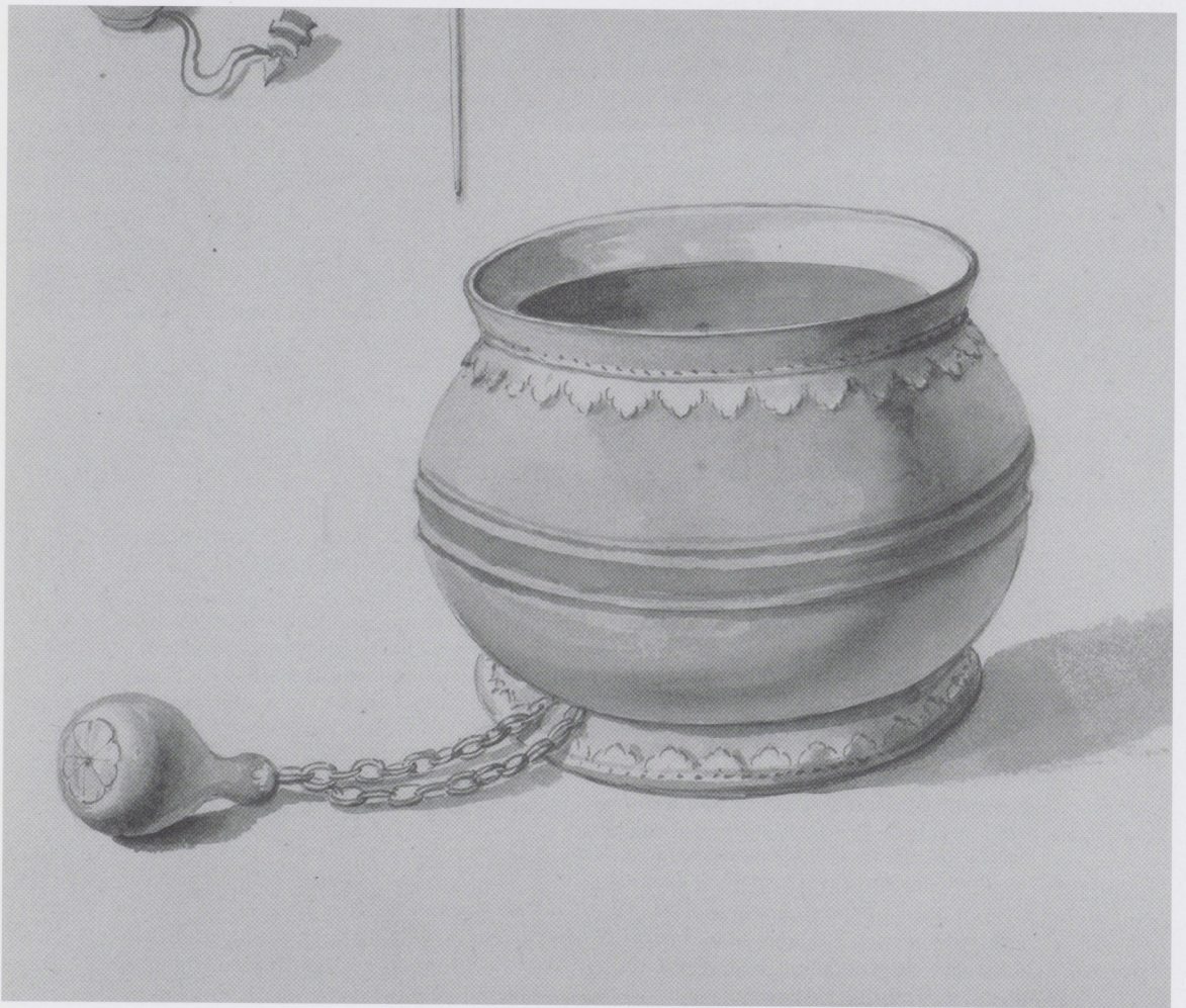
Afb. 1. Joost van Attevelt, Een bedelnap met zilverbeslag (detail), circa 1670. Aquarel op papier, 220 x 340 mm. Het Utrechts Archief, Verzameling Van Buchell/Booth, inv.nr. 50.