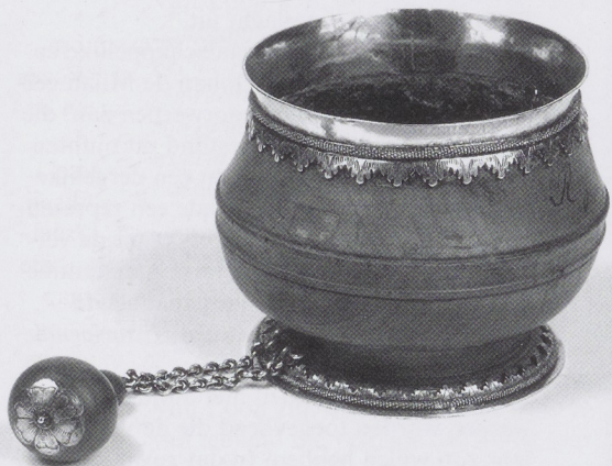
Afb. 3. Bedelnap met zilverbeslag. Gedraaid hout. Rijksmuseum, Amsterdam, inv.nr. NG-NM-878a.

kundige die zich had toegelegd op het documenteren van de Utrechtse geschiedenis. Van Buchell schreef een groot aantal in manuscript bewaarde werken die voor onderzoekers van de Utrechtse geschiedenis nog steeds van onschatbare waarde zijn, omdat ze behoren tot de rijkste bronnen voor de kennis van het dagelijks leven in Utrecht in de late 16de en vroege 17de eeuw. 9