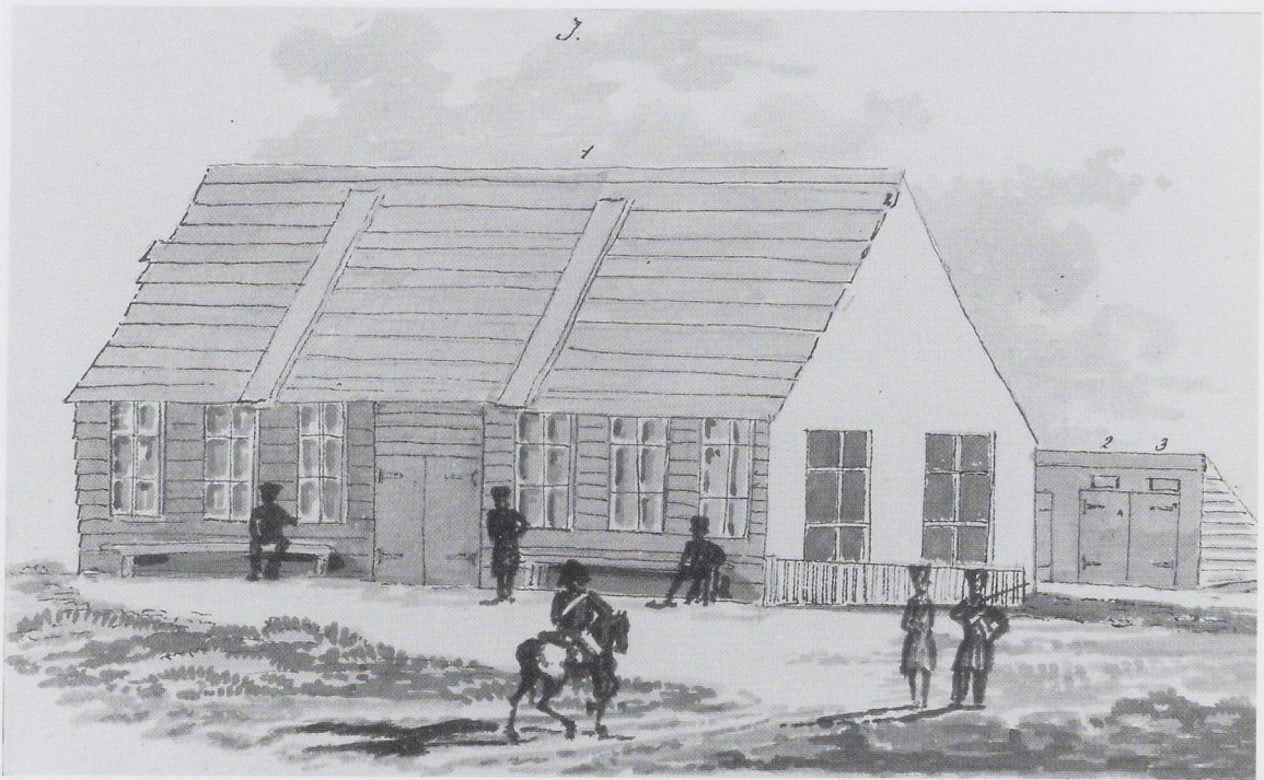
Afb. 11. J.P. Blom, Latrine of sekret (van binnen) voor de officieren van het Noord-Hollands Bataljon. Gewassen pentekening. Archiefdienst Kennemerland, Haarlem, inv.nr. Hs 237.