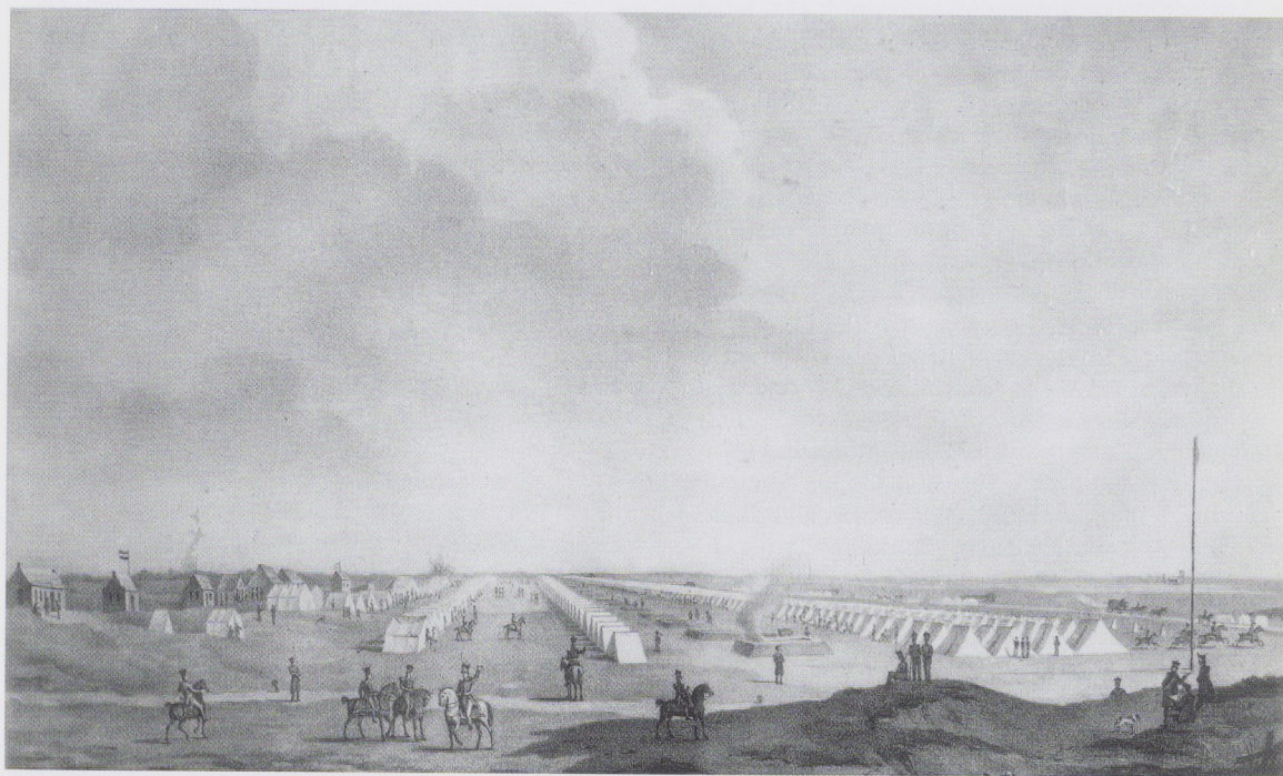
Afb. 5. D.T. Gevers van Endegeest, Het kamp te Reijen, 1831. Gewassen pentekening. Atlas van Stolk, Rotterdam, inv.nr. 7117-27.