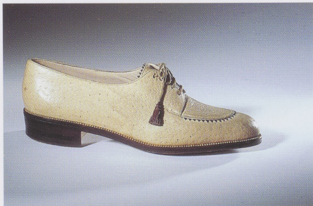
Afb. 5c. Paar veterschoenen van naturelkleurig struisvogelleer versierd met bruin kalfsleer. Op de binnenzool: VAN GOETHEM/15. Rue de Namur/près la Place Royale/Bruxelles. Circa 1930-1940 (inv.nr. BK-1997-62-a/b) 191011f