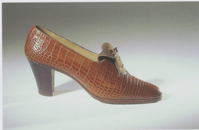
Afb. 5b. Paar schoenen van roodbruin slangenleer met een tong van bruine suède, waarin een geregen en gestrikte leren veter. Op de binnenzool: VAN GOETHEM/15 Rue de Namur, près la Place Royale/Bruxelles. Circa 1930-1940 (inv.nr. BK-1997-58-a/b) JCD .