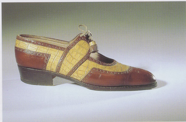
Afb. 5a. Paar veterschoenen van naturelkleurig krokodillenleer en geperforeerd bruin kalfsleer met dito veterkwasten. Op de binnenzool: BASTIEN/6 Rue de Loxum 6/Bruxelles. Circa 1920-1930 (inv.nr. BK-1997-61-a/b) JCD .