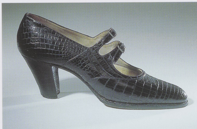
Afb. 5f. Paar bandschoenen van blauwzwart krokodillenleer met gespsluiting en hoge, onbeklede hak. Op de binnenzool: A. VAN GOETHEM/15 Rue de Namur/près la Place Royale/ Bruxelles. November 1939. Met zwarte inkt is in de holte van spanleest geschreven 'nov. 39/croco noir'. (inv.nr. BK-1997-53-a/b) ic/d