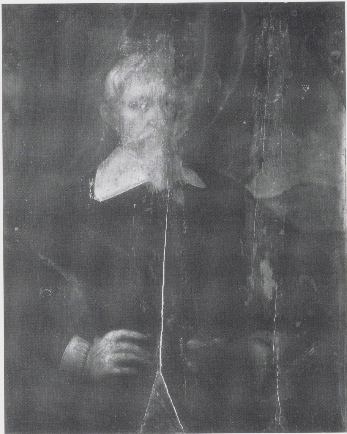
Afb. 1. Anoniem (midden 17de eeuw), Portret van Gouverneur-Generaal Hendrik Brouwer (1632–1636). Olieverf op paneel, 97,5 x 78,5 cm. Rijksmuseum, Amsterdam, inv.nr. Sk-A-3761. Toestand vóór behandeling.