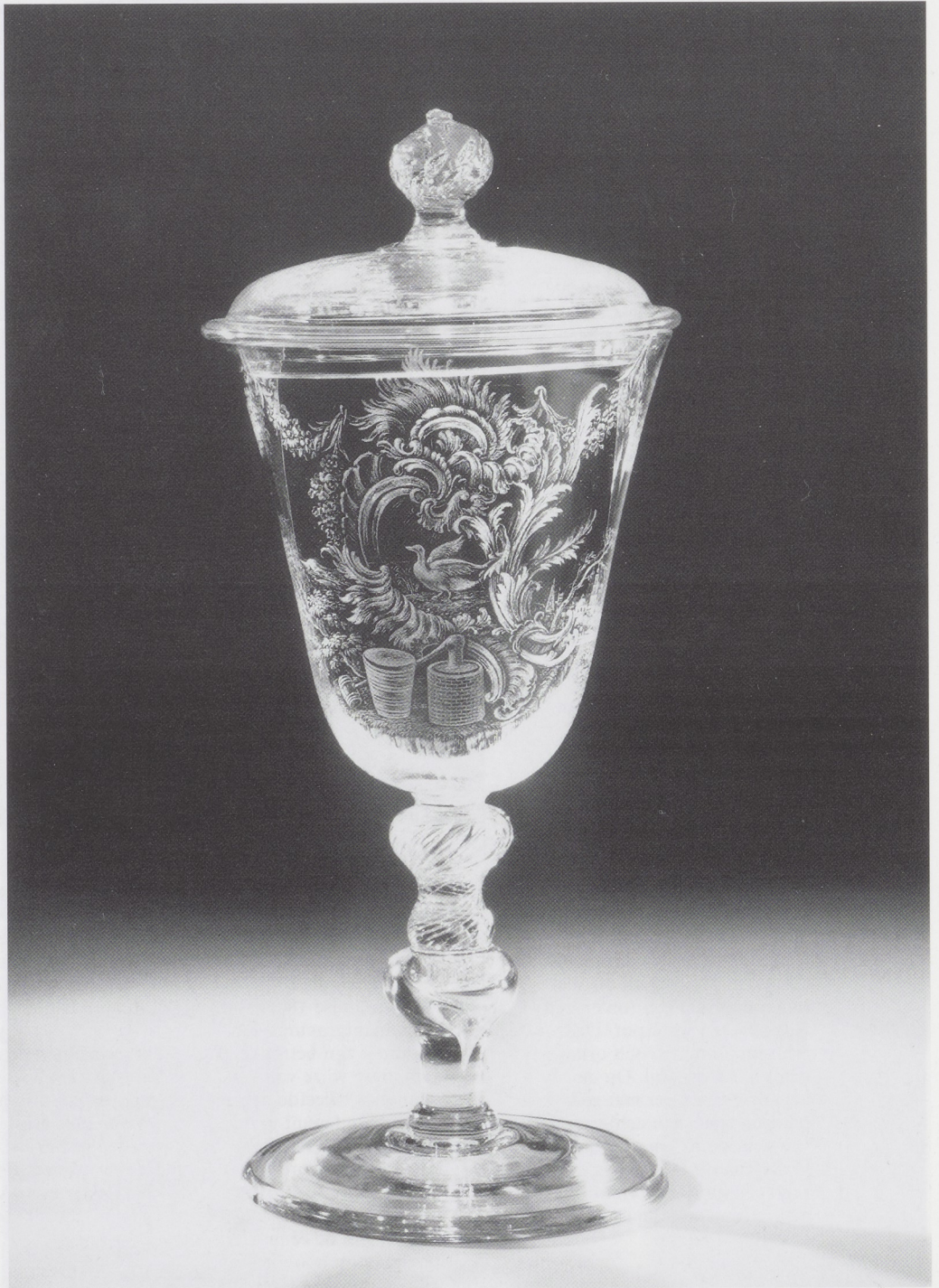
Crystal chalice with lid, cut glass design.