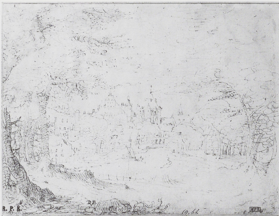
Afb. 1a-b. Coenraet van Schilperoort, Gezicht op een stad (verso) en Boslandschap (recto) . Pen en penseel in bruin, 154 x 201 mm. Rijksprentenkabinet, Amsterdam.