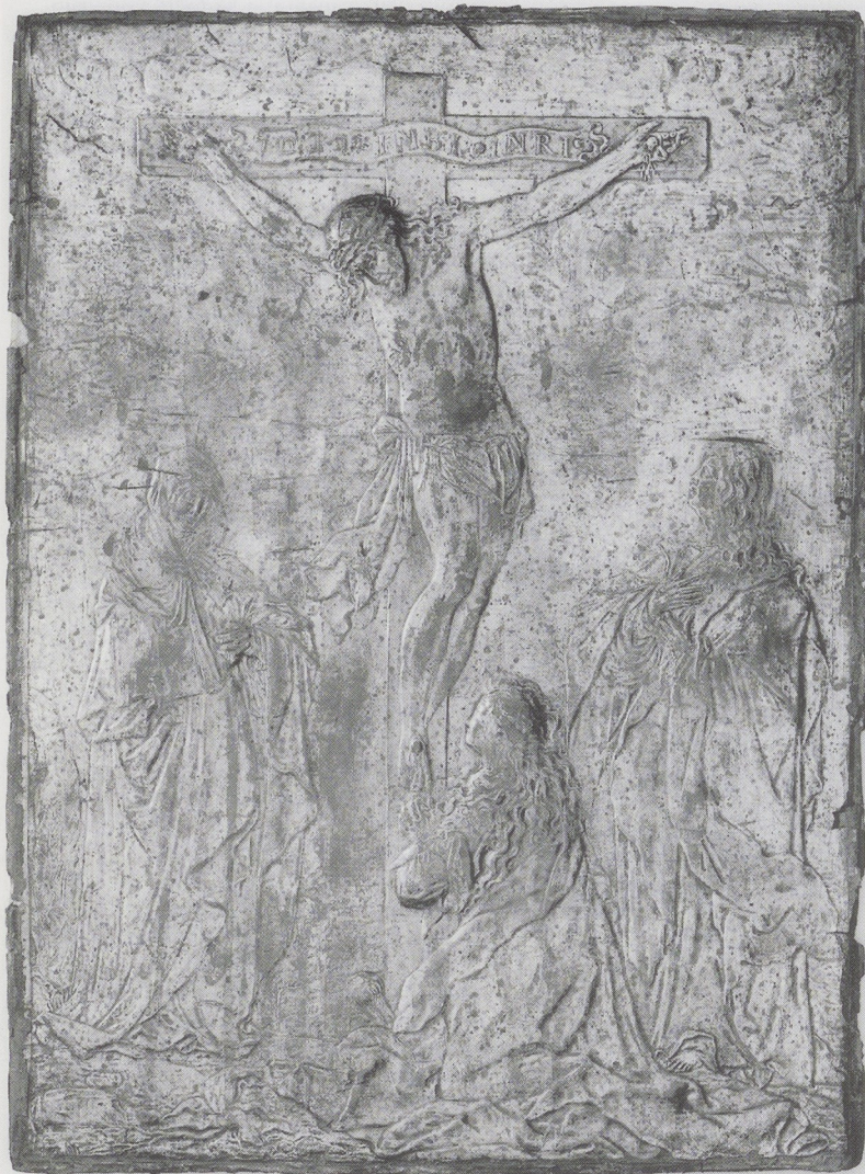
Afb. 5. Paneel van goudleer, zilverkleurig, met de Kruisiging van Christus.

H. 43,3 cm, Br. 32 cm. Op een banderol op het kruis de letters: INRI in het Hebreeuws, het Grieks en het Latijn, links van de onderzijde van het kruis het opschrift: MORS REDEVIVA PIIS . Op de achterzijde in zwart: L 250 (vermoedelijk 18de-eeuwse hand) en in rood: CAT No 28 .