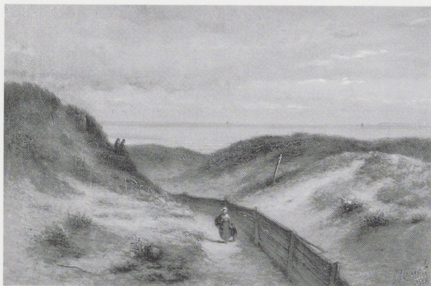
Afb. 7. Jacobus Jan Cremer, Duinlandschap , 1878. Olieverf op doek, 38,5 x 58,5 cm. Collectie Letterkundig Museum, Den Haag.

pad gegaan: Ze droegen lustig hun schilderkistjes of schetsboeken met de zonneschermen en schilderstoeltjes erbij, ofschoon 't een heele vracht was. Daar ging het dan al stijgende den hollen zandweg door, straks den Pietersberg over, die een zoo heerlijk panorama te genieten geeft; al verder, nu eens rechts en dan weer links, door de lanen en langs de vijvers van den