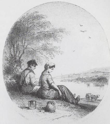
en deë aelzich kriekake voor raegen dat in 't gres lenekte