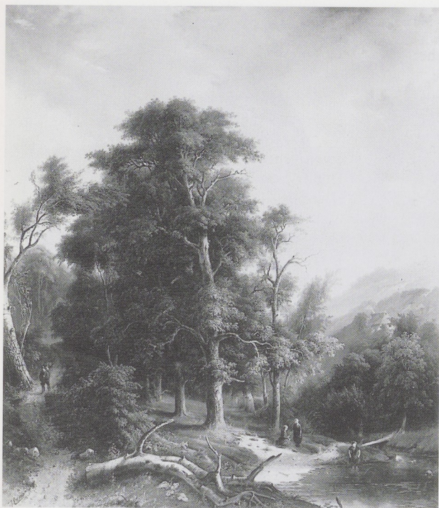
Afb. 6. Jacobus Jan Cremer, Bosgezicht , 1852. Olieverf op doek, 140 x 120 cm. Gemeentemuseum, Arnhem.

1846 blijven om tot landschapschilder te worden opgeleid.