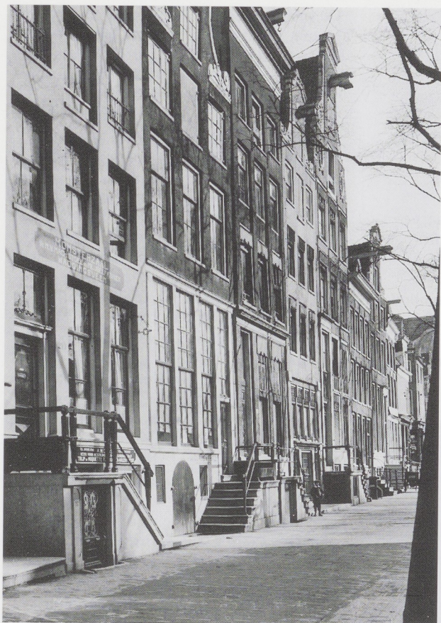
Afb. 4. Herengracht 295 (het tweede pand van links) met de naam Claus & Fritz op de pui. De foto is gemaakt vlak voor de afbraak in 1915.

ger die in het Rijksprentenkabinet bewaard worden. De firma Claus & Fritz kocht, verspreid over de jaren 1842–1862, zes schilderijen van deze meester waarvoor zij tussen de 50 en 100 gulden per stuk betaalde. 8 Na de dood van Claus bleef de zaak Claus & Fritz heten. De geschreven aanbevelingsbrief geeft aan dat de firma vanaf 1841 verf fabriceerde. Of de fabricage van verf en andere kunstenaarsbehoeften op het bovengenoemde winkeladres geschiedde, is onzeker. De firma Claus & Fritz was op de Herengracht namelijk niet al te ruim behuisd. 9 Mogelijk werd het pand alleen als winkel en galerie gebruikt, terwijl de fabricage van verf elders plaatsvond.