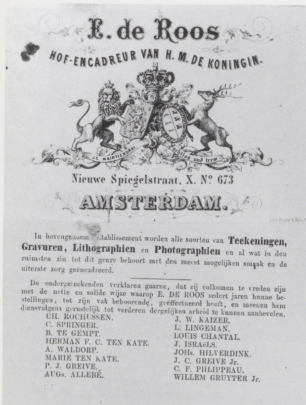
Afb. 3. Etiket van de firma E. de Roos te Amsterdam op een inlijsting in het Rijksmuseum, Amsterdam.

gezonden en niet weinig moeilijk te beantwoorden!