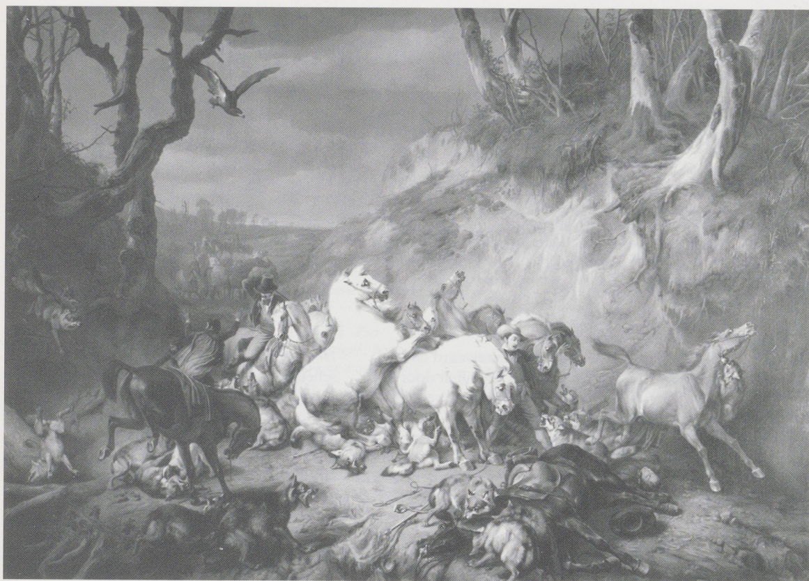
Afb. 1. Eugène Verboeckhoven, Hongerige wolven overvallen een groep ruiters , 1836. Olieverf op doek, 256 x 363 cm. Rijksmuseum, Amsterdam.

van de slachtoffers en hij liet het Koninklijk Instituut van Ingenieurs een prijsvraag uitschrijven tot het ontwerpen van zogenaamde vlugtheuvels om in geval van een nieuwe overstroming te dienen als toevluchtsoord. Ook ondersteunde hij tal van initiatieven die door de Nederlandse bevolking ten behoeve van de getroffen en werden georganiseerd, zoals een Algemene Collecte in februari en de Algemene Verloting in april van datzelfde jaar. 6 Op 19 januari 1861 gaf koning Willem III bij Koninklijk Besluit goedkeuring aan het voorstel om een Algemene Verloting van kunst en smaak ten behoeve der noodlijdenden door den jongsten watersnood in Den Haag te houden. Uit eigener beweging stelde de koning de Gotische Zaal, de aangrenzende galerij en de toren van het paleis aan de Kneuterdijk in Den Haag beschikbaar. Voordat de verloting plaatsvond, zouden de voorwerpen daar eerst veertien dagen tentoongesteld worden. In