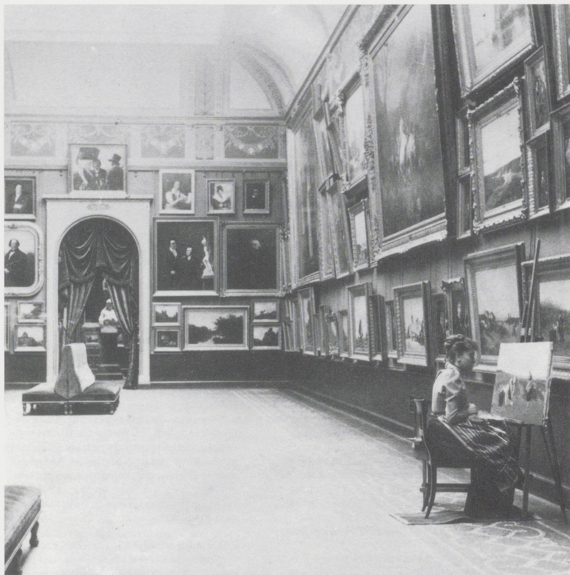
Afb. 5. De Waterloozaal van het Rijksmuseum in 1893 met rechts op de wand het schilderij van Verboeckhoven.

kamer de aanvraag van betaling wederom onverevend terug. Men had alleen willen weten of het schilderij betaald moest worden uit de post voor aankopen voor het Koninklijk Kabinet van Schilderijen in Den Haag, of die voor het Rijksmuseum in Amsterdam of uit de post voor kunstwerken van levende meesters op het Paviljoen bij Haarlem. Aangezien Thorbecke echter geen van deze