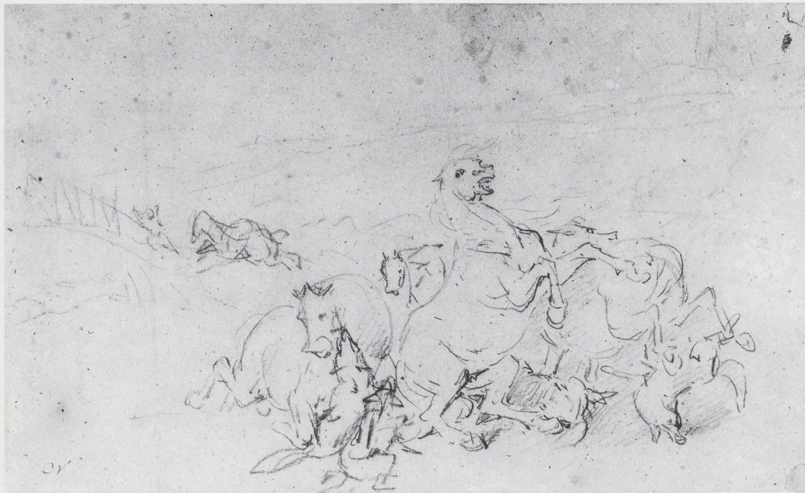
Afb. 6. Eugène Verboeckhoven, voorstudie voor het schilderij 'Hongerige wolven overvallen een groep ruiters'. Potlood op lichtbruin papier, 150 x 245 mm. Rijksprentenkabinet, Amsterdam.