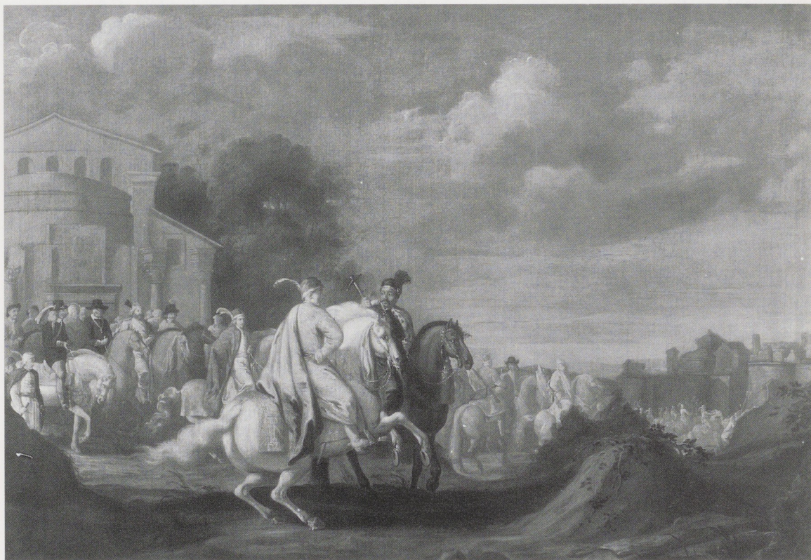
Afb. 28. Detail uit anoniem 18e-eeuws schilderij naar tekening van Abraham Westervelt, Vorst Janusz Radziwili van Litouwen trekt de veroverde stad Kiev binnen in 1651. Voorheen in de collectie van het Schlossmuseum, Warschau. Verbrand in 1939.