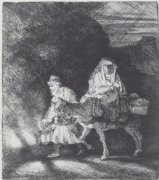
Afb. 11. Rembrandt, De Vlucht naar Egypte bij nacht , 1651. Ets (B. 53), staat 1 (2), 127 × 111 mm. Rijksprentenkabinet, Rijksmuseum, Amsterdam.