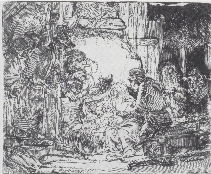
Afb. 1. Rembrandt, De aanbedding van de herders: met de lamp , ca. 1654. Ets (B. 45), staat 1 (2), 105 × 129 mm. Rijksprentenkabinet, Rijksmuseum, Amsterdam.

die in de verschillende staten zijn aangebracht, zijn er in de individuele afdrucken verschillen te zien door het veelvuldig gebruik van plaattoon en doordat voor het afdrucken behalve wit papier ook het geelgetint Japans papier is gebruikt. In dat opzicht bestaan er weinig prenten waaraan men het experimentele karakter van het late etswerk van Rembrandt beter kan laten zien.