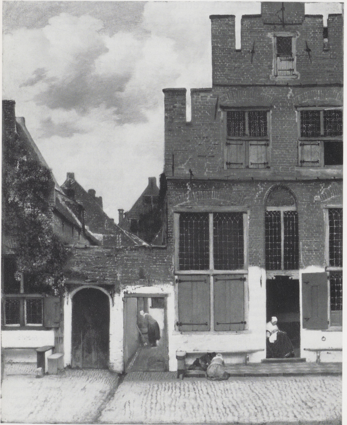
Afb. 1. Johannes Vermeer, Gezicht op huizen in Delft , bekend als 'Het straatje'. Olieverf op doek, 54,3 × 44 cm.