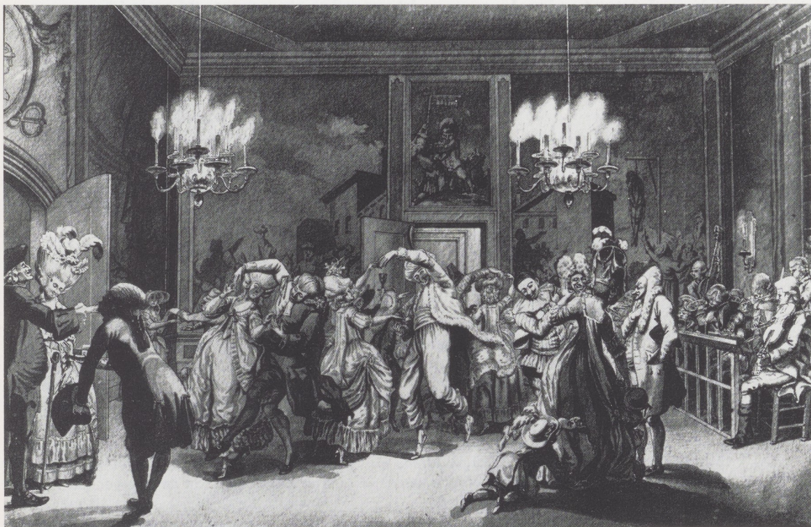
Afb. 1. Pieter Wagenaar Jr., Bal tijdens het Poerimfeest , 1780. Tekening, pen en penseel in grijs, 143 × 226 mm. Gemeentearchief, Amsterdam.

zeer verzorgde tekenrant zal er weinig moeite mee hebben om meer voorbeelden van het werk van deze eigenaardige tekenaar te herkennen. Zo bevindt zich in het Rijksprentenkabinet op naam van Hendricus Wilhelmus Couwenberg (1814–1845) een tekening die zonder twijfel aan Wagenaar toegeschreven kan worden (afb. 3). 5 Vooral de houdingen der figuren zijn te vergelijken met die op Wagenaars Poerimbal en de gelaatsuitdrukking van de vrouwelijke hoofdpersoon komt zeer dicht bij die van de violist in het joodse feestorkest. Gezien het formaat en de voorstelling moet de tekening in het Rijksprentenkabinet bedoeld zijn als ontwerp voor een boekillustratie; de gegraveerde versie daarvan is echter nog niet gevonden. Ook het Prentenkabinet der Rijksuniversiteit te Leiden blijkt een tekening van Wagenaar te bezitten. Dit blad werd tot nu toe toegeschreven aan Reinier Vinkeles (1741–1816) (afb. 4). 6 De buitengewoon fijne afwerking