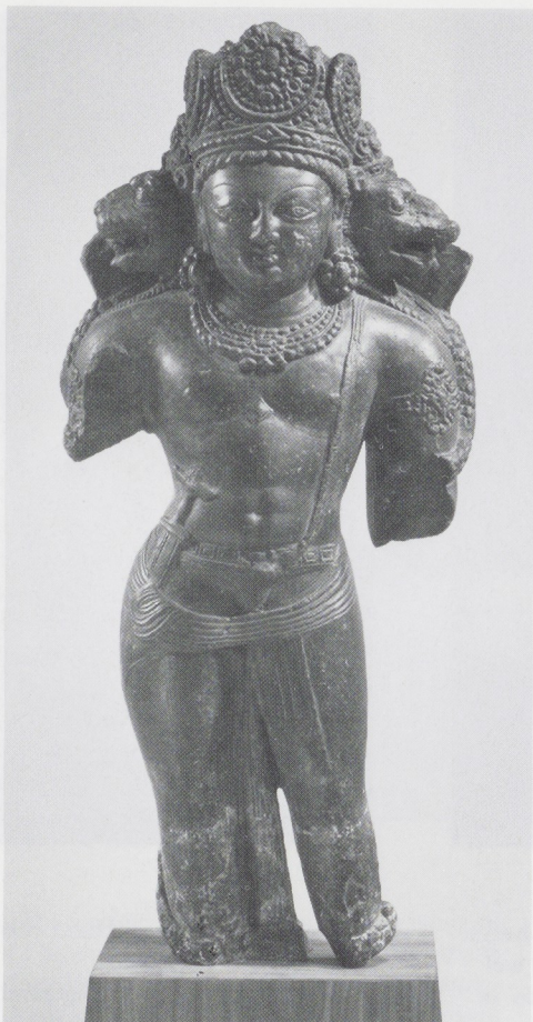
Afb. 4. Vierhoofdige Vishnu, Kashmir, eind achtste – begin negende eeuw, Los Angeles County Museum of Art.