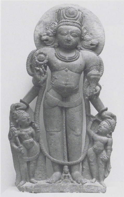
Afb. 8. Vierhoofdige Vishnu, Kashmir, elfde eeuw, Musée Guimet, Parijs.

(afb. 6 en 7) 20 is het aureool weggelaten en de bloemenkrans blijft nu geheel zichtbaar doordat hij over de schouderbladen, onder de demonenkop langs, doorloopt. Op deze manier zou hij bij stervelingen niet blijven hangen. Als er, zoals het mij toeschijnt, sprake is van een ontwikkeling van het uitbeelden van een driehoofdige naar een vierhoofdige gestalte van Vishnu, dan moet zo de volgorde zijn geweest. Voor deze zienswijze pleit ook, dat bij de beelden van Avantipur het hoofd in verhouding tot het lichaam nogal groot is uitgevallen. Het verschil tussen de leeuw- en de zwijnskop is minimaal. De weergave van de lichaamsvormen is wat saai. Het gezicht is niet zo vol als bij ons beeld en de kin loopt spits toe. De beelden uit Verinag die nog weer zo'n twee eeuwen jonger zijn dan die uit Avantipur zijn duidelijk vlakker en meer verstard (afb. 8). 21 In de tijd kan onze Vishnu dan worden geplaatst tussen de pas gevonden driehoof-