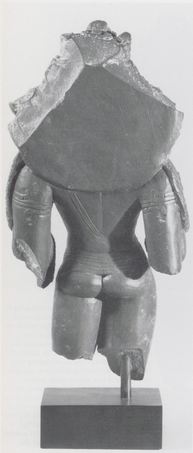
Afb. 3. Achterzijde van het beeld van afb. 1.

Naast deze vierhoofdige gestalte van Vishnu, die in Kashmir verreweg het populairst is geweest, en naast de driehoofdige, bestaat er ook nog een met één hoofd. 9 Ongetwijfeld hebben deze verschijningsvormen met één, drie en vier hoofden naast elkaar bestaan. Die met één hoofd komt in heel India het meest voor. De manifestatie met het vierde, demonische gezicht ontstond vermoedelijk in Kashmir in de achtste eeuw. In het Vishnu-dharmottarapurana, een tekst vol iconografische gegevens, waarvan men aanneemt, dat deze in de achtste eeuw in Kashmir is samengesteld, worden één-, drie- en vierhoofdige manifestaties van Vishnu behandeld. 10 Misschien was de vierhoofdige gestalte daar toen net geïntroduceerd en werd hij in dit geschrift voor het eerst te boek gesteld. Over één ding is men het eens: Vishnu met de vier gezichten is in Kashmir ontstaan en daar eeuwenlang in verering gebleven.