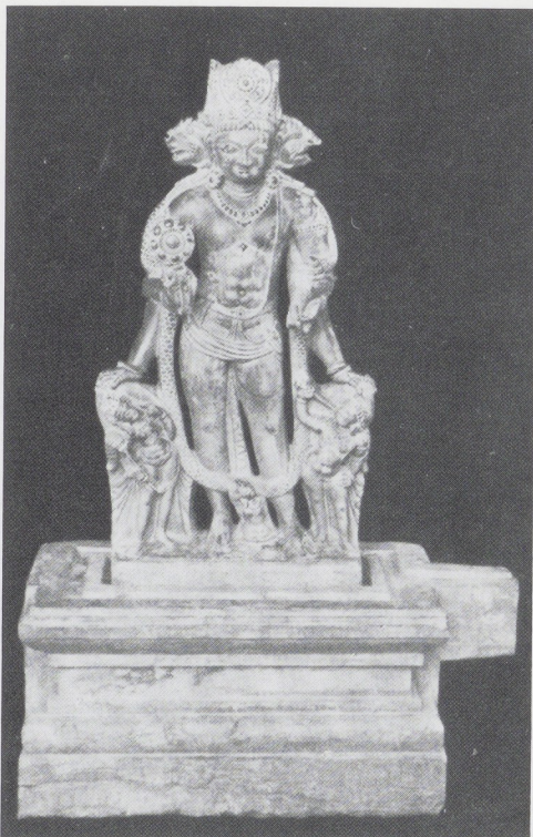
Afb. 6. Vierhoofdige Vishnu uit Avantipur, Kashmir, tweede helft negende eeuw, Sri Pratap Singh Museum, Srinagar.