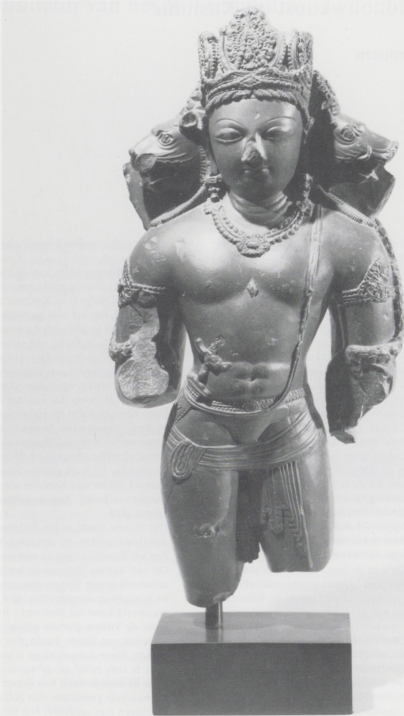
Afb. 1. Driehoofdige Vishnu, Kashmir, tweede helft achste–begin negende eeuw. Aanwinst 1990.