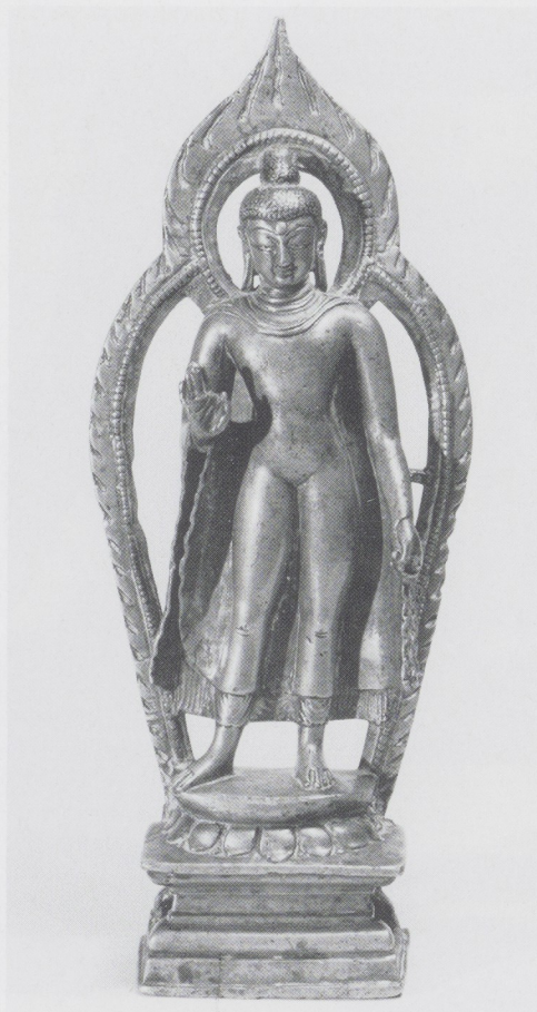
Afb. 12. Bronzen beeld van een staande Boeddha. Kashmir, tiende eeuw. Aanwinst 1990.