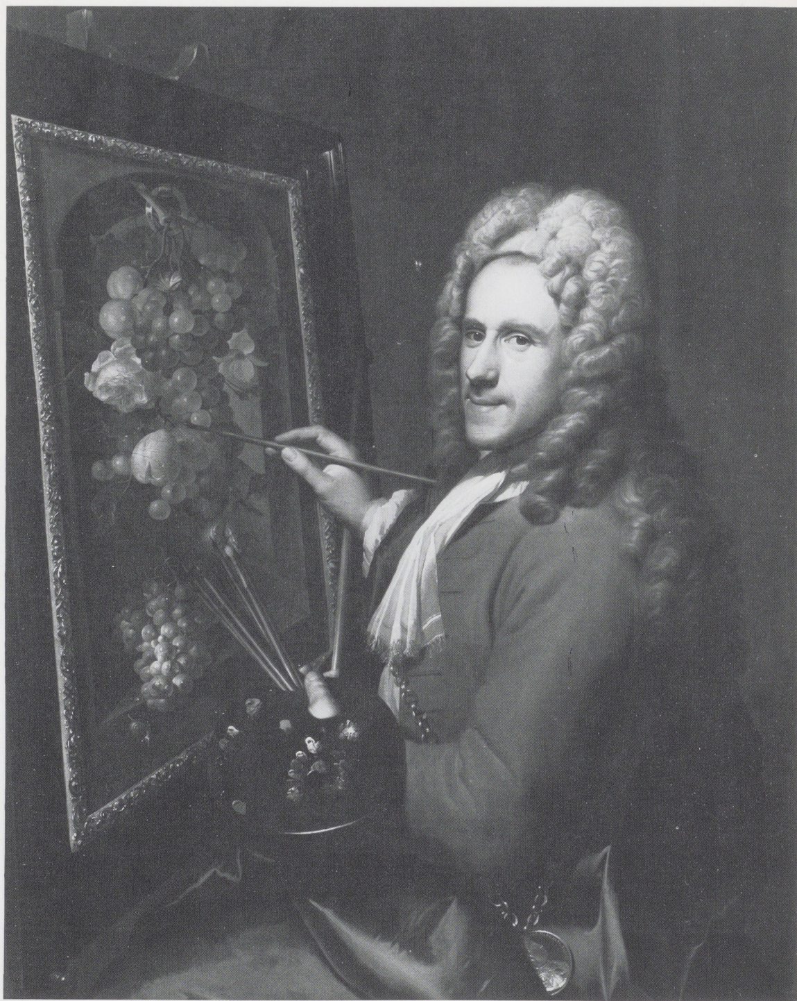
Afb. 3. Richard van Bleeck en Coenraat Roepel, Portret van Coenraat Roepel. Doek, 110,5 x 87,2 cm. Particuliere collectie, Australië.