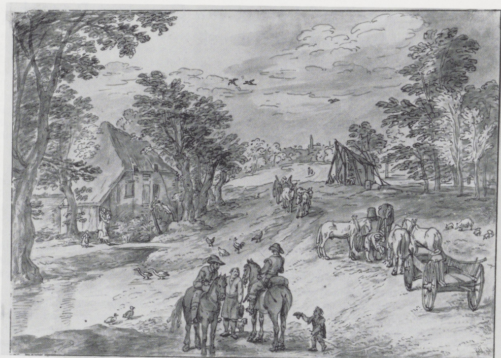
Afb. 1. Richard van Bleeck naar Jan Brueghel II, Rust op een landweg. Pen in bruin, penseel in grijs, 187 × 260 mm. Fondation Custodia, Parijs.