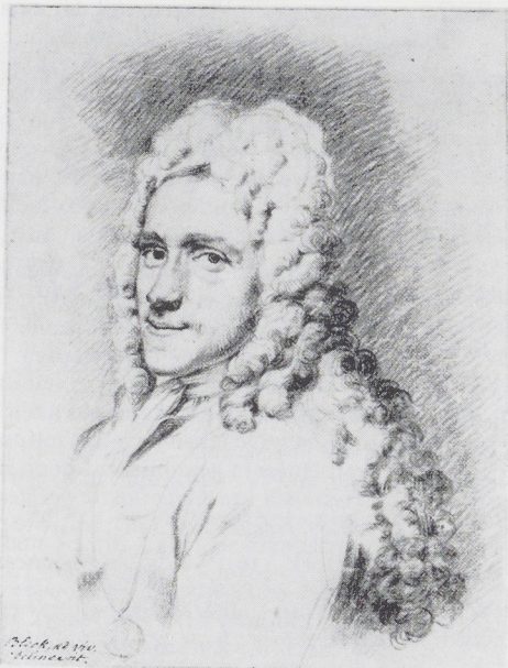
Afb. 5 (boven). Copie naar Richard van Bleeck, Portret van Coenraat Roepel. Rood krijt over potlood, 214 × 163 mm. Rijksprentenkabinet, Amsterdam. Afb. 6 (onder). Coenraat Roepel, Bloemstilleven. Doek, 56 × 37 cm. Huidige verblijfplaats onbekend.