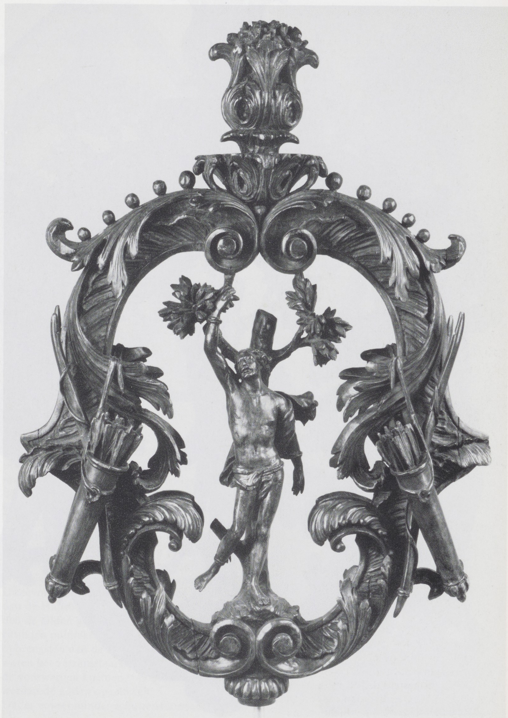
Afb. 3. Bekroning van de processietoorts van een Sebastiaansgilde, lindehout, Antwerpen, ca. 1750. Rijksmuseum, Amsterdam.