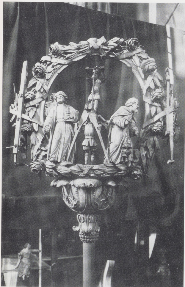
Afb. 1. Processietoorts van de Houtbrekers te Gent, met de Drie Koningen, 1720-1740. Bijlokemuseum, Gent.

delijk Antwerps. Het is een variant op een Sebastiaanfiguur die in 1661 in Antwerpen werd gemaakt door Artus Quellinus de Jonge in opdracht van het handboogschuttersgilde van die stad (afb. 6). Dit beeld behoorde bij het gildealtaar in de Onze Lieve Vrouwe kathedraal. 10 Bij de 'Berchemse' Sebastiaanfiguur werd het voorbeeld van Quellinus gevolgd in de gelaatsuitdrukking met de iets geopende mond, in het halflang krullend haar en de snor en in de plooiing van het gewaad rond het lichaam. Wel moet worden vastgesteld dat dit werk bijna een eeuw later is vervaardigd dan dat van Quellinus. Daarop wijst het luchtige, enigszins arabeske