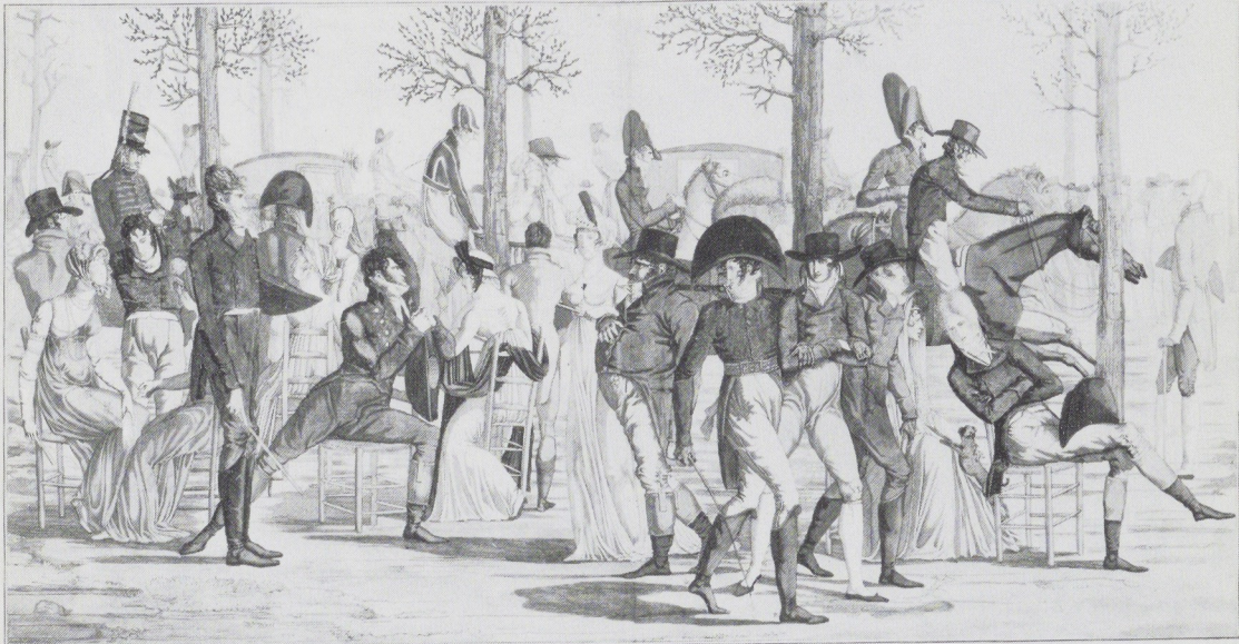
Festivité de Longchamp