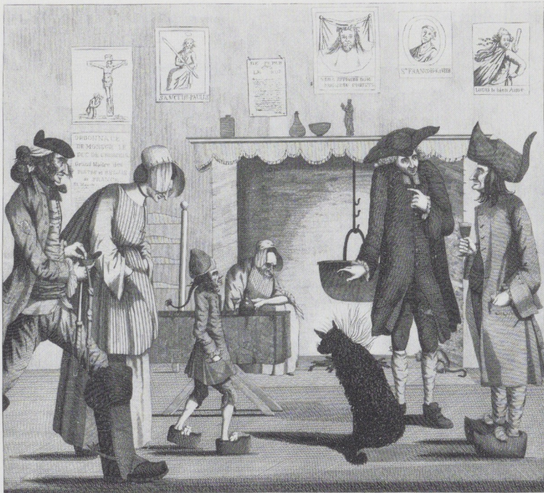
THE KITCHEN OF A FRENCH POST-HOUSE. LA CUISINE DE LA POSTE