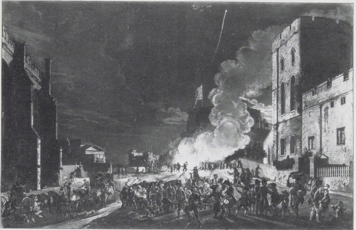
Windsor Castle from the River Court on the 3 d of Nov.