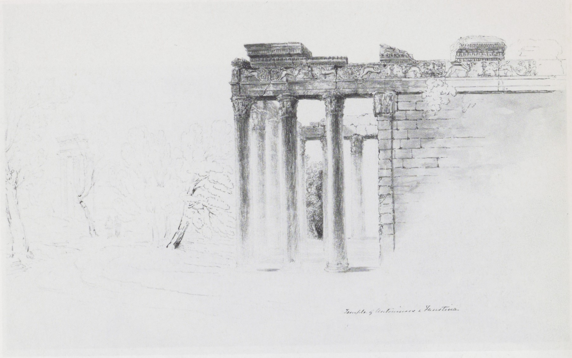
Temple of Antoninus & Faustina