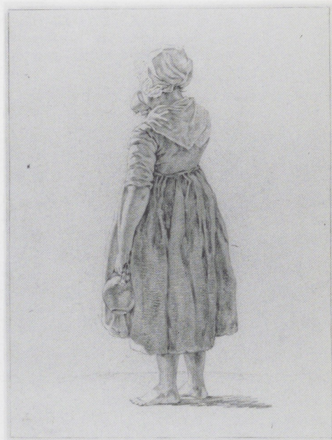
Afb. 13 (onder). Albertus Brondgeest, Staand meisje dat drinkt uit een kom, 1810. Rood krijt, 220 × 147 mm. Prentenkabinet der Rijksuniversiteit, Leiden.