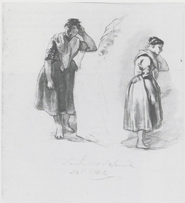
Afb. 1. Albertus Brondgeest, Twee studies van een staande vrouw, 1815. Rood krijt, penseel in bruin, 208 x 191 mm. Particuliere collectie.

toetrad tot het genootschap Zonder Wet of Spreuk kan het manuscript uit de nalatenschap van Ruytenschildt gedateerd worden tussen 1813 en 1820 aangezien Brandt als eerste van de ledenlijst op 12 februari 1821 stierf. In deze periode viel 4 november alleen in 1816 op een maandag. 7