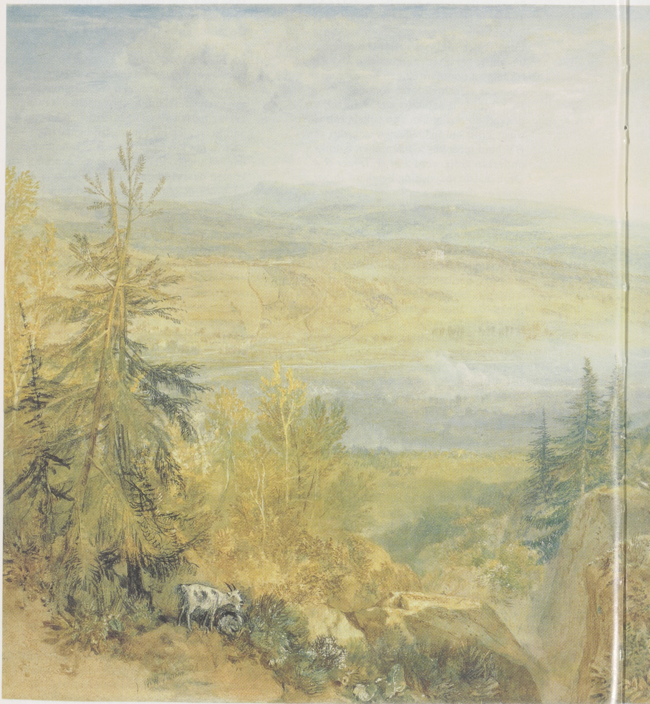
Afb. 1. Joseph Mallord William Turner, Gezicht op Farnley Hall in het dal van de Wharfe in Yorkshire. Aquarel en dekverf, 285 × 396 mm. Rijksprentenkabinet, Amsterdam.