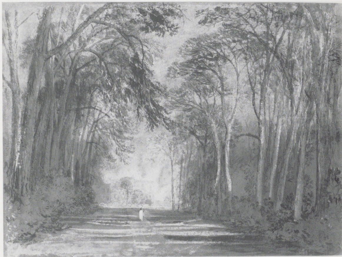
Afb. 10 (onder). Joseph Mallord William Turner, De 'Library Hall'. Potlood, Farnley-schetsboek, 111 × 190 mm (fol. 15 verso-16, 17). The Clore Gallery for the Turner Bequest, Tate Gallery, Londen.