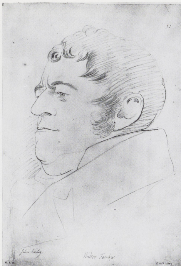
Afb. 6. John Varley, Portrait of Walter Fawkes. Potlood, 330 x 228 mm. Victoria & Albert Museum, Londen.

partij met Fawkes, en uit dezelfde tijd het Devonshire Rivers, No. 3 and Wharfedale -schetsboek met hoofdzakelijk gezichten in Yorkshire. 13