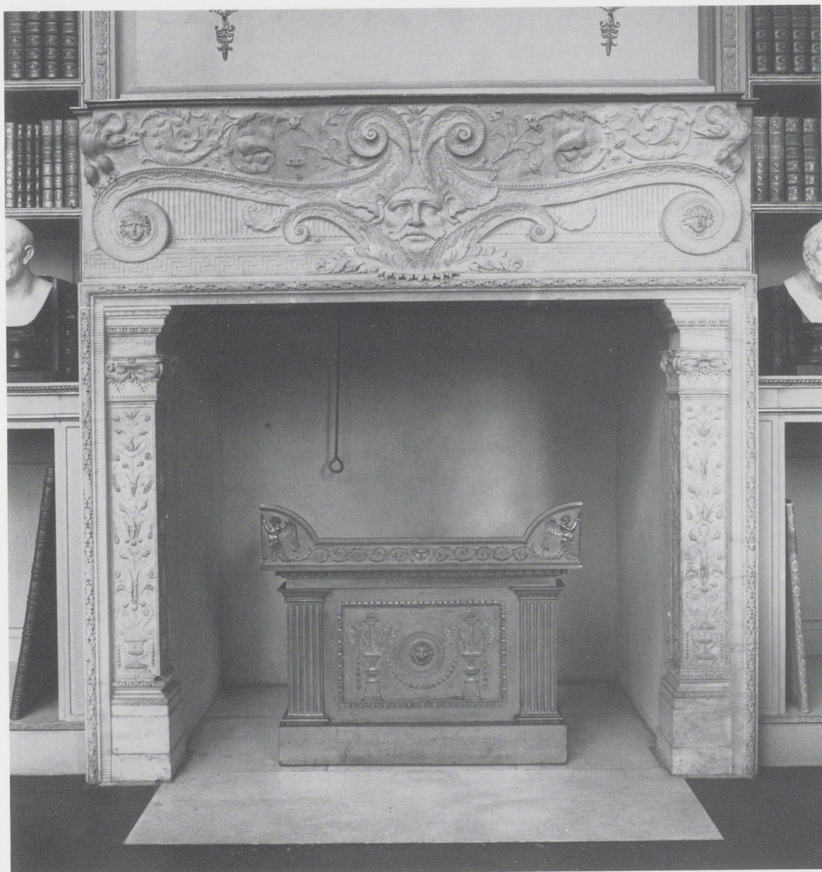
Afb. 11. De Piranesi-schoorsteenmantel in het Paviljoen van Gustaaf III, bij Stockholm, met om de hoek gemodelleerde vogels.

1915 werd de grote schoorsteenmantel 29 overgebracht naar Amstel 218, waar hij nu in de zaal staat: strak classicistisch, van wit marmer, de zijstijlen met gladde stukken porfier, geaccentueerd door bronzen biezen, waarboven medaillons in hoogrelief, die een