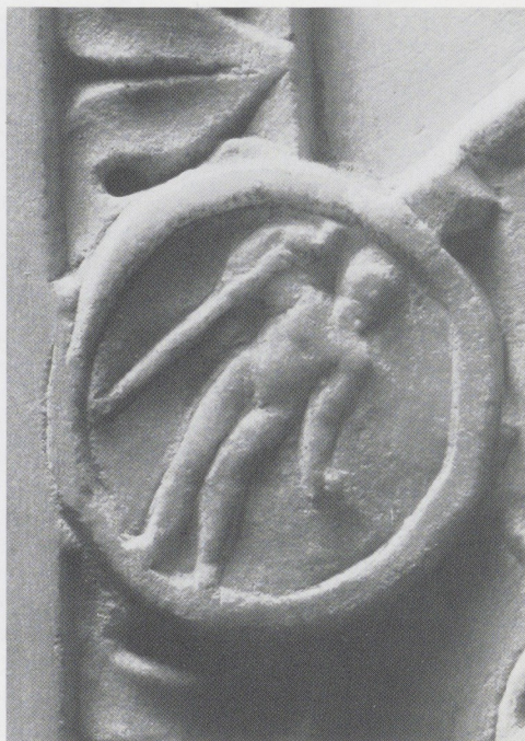
Afb. 6. Medaillon met staande satyr, linksonderaan op de rechter hermschacht. Hope-schoorsteenmantel. Rijksmuseum, Amsterdam.

uit een stuk marmer, gevormd door een voetstuk met gestileerde bladeren en eikels, waaronder een gladde plint die naar achteren doorloopt; hierboven opzij een vlak stuk marmer als aanvulling (afb. 7). De posten van de dagkant, dus om het stookgat, gevormd door de smalle band met laurierbladeren, zijn tegen de binnenzijde van de pilasters aangezet. De stijlen hebben een antieke kern, maar zijn aan weerskanten aangevuld om de omlijsting rechthoekig te maken. Opvallend is dat de adelaars op het fries als het ware tegen de koppen zijn aangedrukt, zonder daarmee een harmonisch geheel te vormen. Tijdens recente demontage is niet alleen gebleken dat de koppen ook aan de binnenzijden bewerkt zijn (afb. 8), wat van oorspronkelijke stukken te verwachten valt, maar dat eveneens de onzichtbare vleugel van de adelaars, recht naar achteren stekend, in laagrelief is uitgevoerd (afb. 9). Hier lijkt Piranesi met een compositieprobleem te hebben geworsteld, dat hij niet bevredigend heeft weten op te lossen (afb. 10). 16 Op de prent is het geheel tegen een vlakke