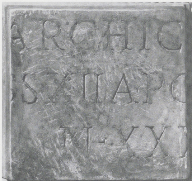
Afb. 2 (linkerpagina). Prent door G.-B. Piranesi met de Hope-schoorsteenmantel. Gepubliceerd 1769. Rijksprentenkabinet, Amsterdam.

stuk marmer. Wanneer ze werkelijk antiek zouden zijn, moeten ze toen een bepaalde functie hebben gehad. Voor de dekplaat, met vooruitspringende gedeelten boven de zijstijlen en in het midden, lijkt dit uitgesloten. Het fries, onder de parelrand van de kroonlijst, boven de laurierbladeren van de smalle architraaf waarvan het horizontale gedeelte niet uit één stuk marmer bestaat en dat links en rechts tot en met de adelaars reikt, heeft