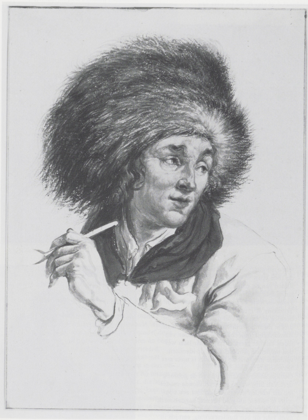
Afb. 1. Abraham van Strij, Man met bontmuts, pijp in de hand. Zwart en rood krijt, penseel in waterverf in bruin en grijs, 227 x 169 mm. Rijksprentenkabinet, Amsterdam.