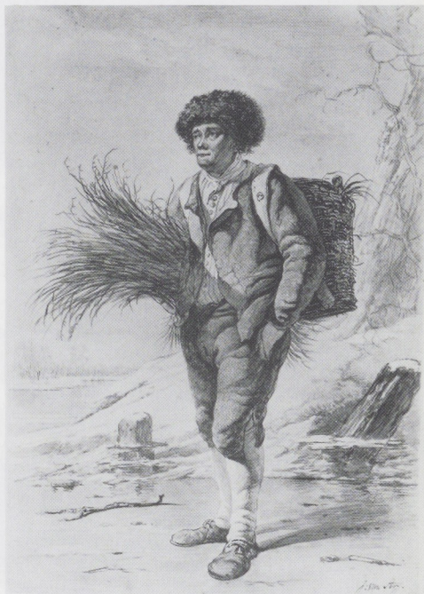
Afb. 6 (onder). Jacob van Strij, Boer met takkenbos en mand op zijn rug. Zwart krijt, penseel in waterverf in grijs, 525 × 373 mm. In 1970 bij de kunsthandel Douwes, Amsterdam.

de collectie Staring en thans in het bezit van de scheidende directeur van het Prentenkabinet (afb. 4), maar ook op tekeningen waar de genootschapsstudies zijn uitgewerkt tot voltooid genrecomposities of de modellen tot typen zijn geworden. 7