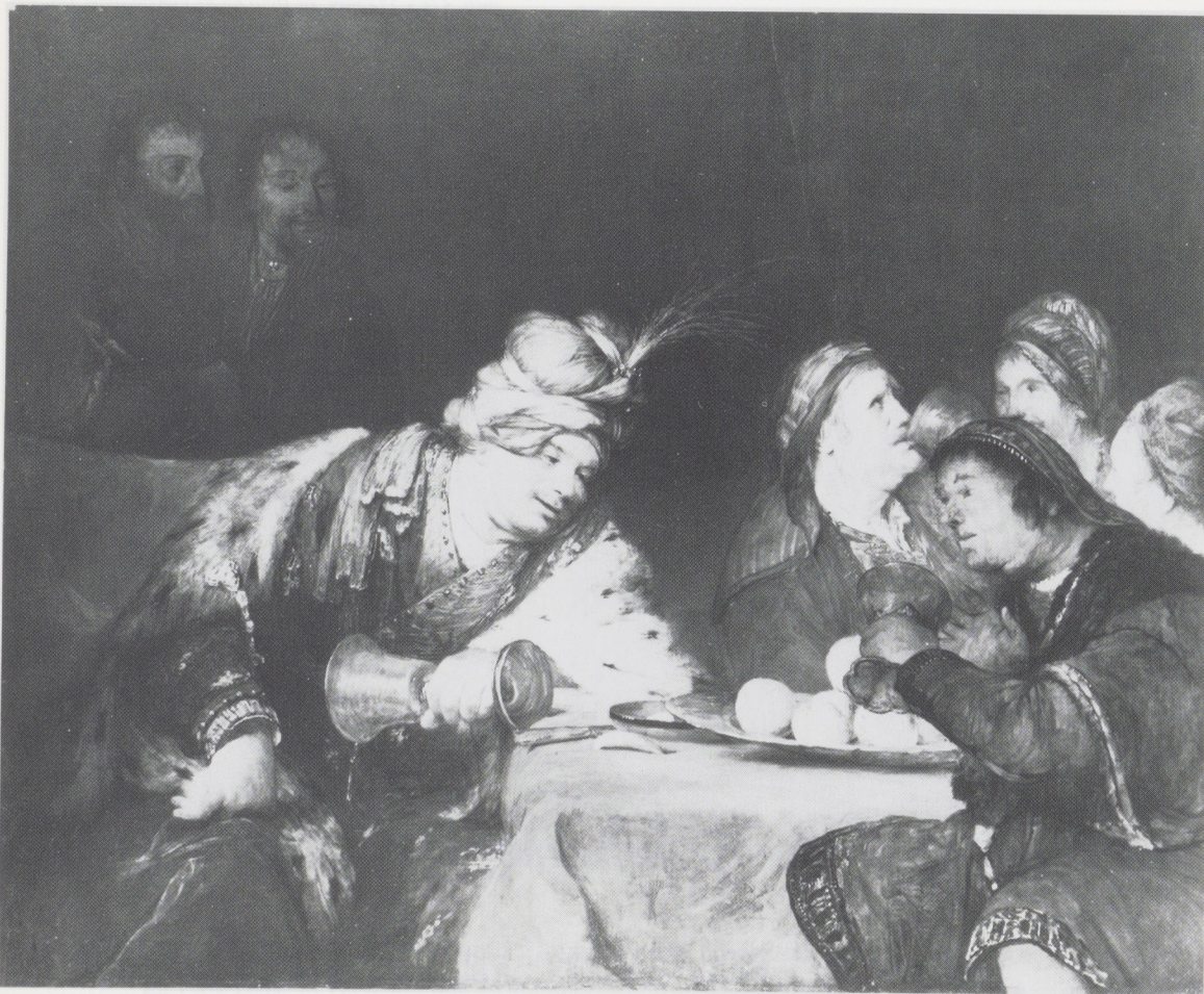
Afb. 7. Aert de Gelder, Het feest van Ahasverus . Olieverf op doek, 112 × 139 cm. J. P. Getty Museum, Malibu.

en, alhoewel wij [lees: kunstminnaars], in de onderwerpen van de gemeenzame of huisselijke soort, zo zeer geen deel neemen, streelen zij onze verbeelding, eger, op een zachte en aangename wyze, door het gevoel van waarheid, die wy, in de overeenkomst tusschen de Naarvolging en de Natuur, ondervinden...', zo luidt het in een redevoering van Cornelis Ploos van Amstel uit 1785. 13 Behalve de naarvolging en de natuur werden door de gebroeders Van Strij ook terdege de voorbeelden uit het glorierijke verleden van de lokale schilderschool in het oog gehouden. Voor de geschilderde landschap-pen van Jacob van Strij stond immer de grote Albert Cuyp model,