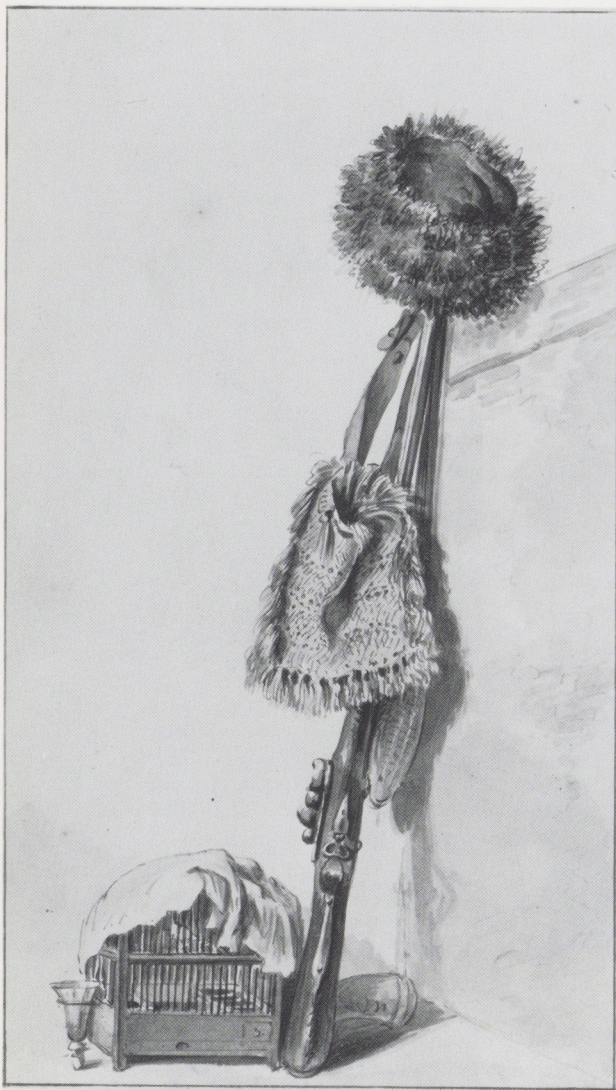
Afb. 11. Jacob van Strij, Jachtstillevens . Zwart krijt, penseel in waterverf in kleuren, 271 × 155 mm. Rijksprentenkabinet, Amsterdam.

een tafereel is gemaakt, compleet met een loerende hond, die zo uit een schilderij van Dirk Hals of Willem Buytewech is weggestapt. Die aquarel wordt nu in het Dordrechts Museum bewaard, samen met de eerste schets in krijt die naar hetzelfde model is getekend (afb. 10). 15 Hoe summier die eerste opzet ook is – het grootste deel van de figuur is uitsluitend door middel van contouren weergegeven – het is wederom de muts die