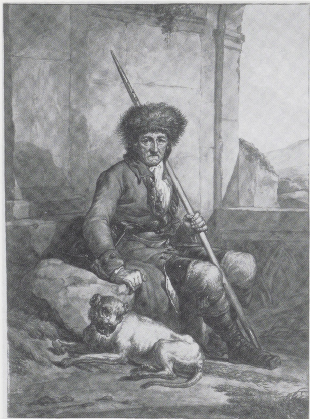
Afb. 5 (links). Abraham van Strij, Zittende herder en een hond. Pen in bruin, penseel in waterverf in kleuren over een potloodschets, 445 × 325 mm. Rijksprentenkabinet, Amsterdam.