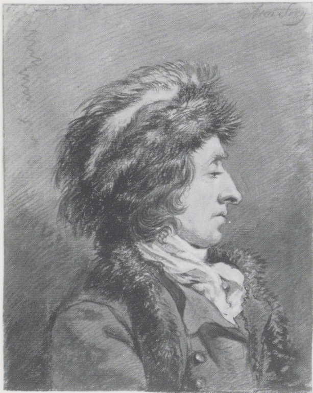
Afb. 2 (links). Abraham van Strij, Man met bontmuts, naar rechts. Zwart krijt, penseel in grijs, 242 × 193 mm. Rijksprentenkabinet, Amsterdam.