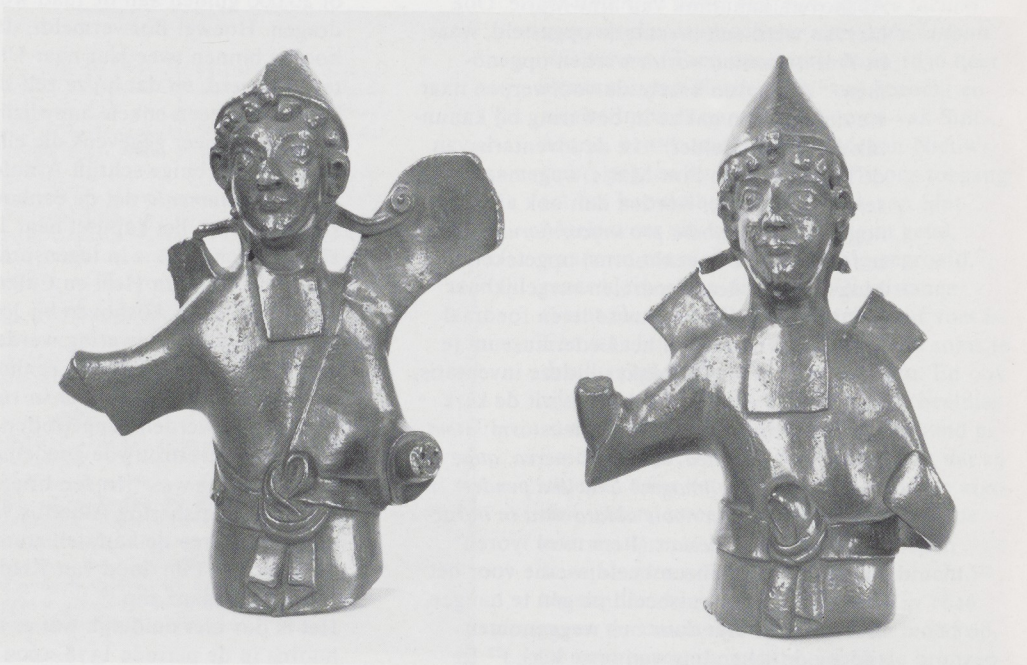
Afb. 5. Twee bronzen beeldjes. Lotharingen (?), tweede helft twaalfde eeuw, brons, h. 19 cm. Rijksmuseum Amsterdam.

hannes Block, schilder, voor de voortgang van enige stenen hoofden, waarin onze eenhoorns worden gezet.) 18 Marcus van Vaernewijck beschrijft de toestand van de eenhoorns in 1574. Zijn beschrijving geeft al enige aanwijzingen voor de vorm van de stenen voetstukken: Binnen Utrecht staen vijf canesiën/ ende een abdye/ en de noch een abdye buyten de mueren: waer af een canesie sinte Mariën ghenoeemt is / daer dry hoorens van eenhoornen in bewaert werden/ daer geschoncken van den keyser Henricus quartus/ die oock de kercke gefondeert heeft ende syn elck ontrent een mans lijngde lanc/ ende syn al wrynghende ghegroeyt/ met der zonne om gaende/ daer op den point vergulden kandelaelers ghemaect syn: want voor den hooghen altaer staen iii figuren van dieren/ die dese hoornen draghen: waer op men de natuerlicke hoornen stelt/ op hooghe feestdaghen/ ende dan stelt men oock bernende keerssen daer boven. 19