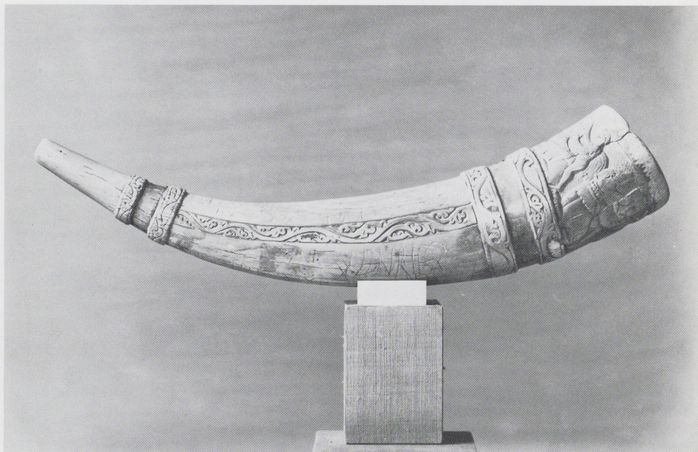
Afb. 4. Jachthoorn. Zuiditaliaans/Saraceens, elfde eeuw, olifantstand, l. 69 cm. Rijksmuseum Amsterdam.