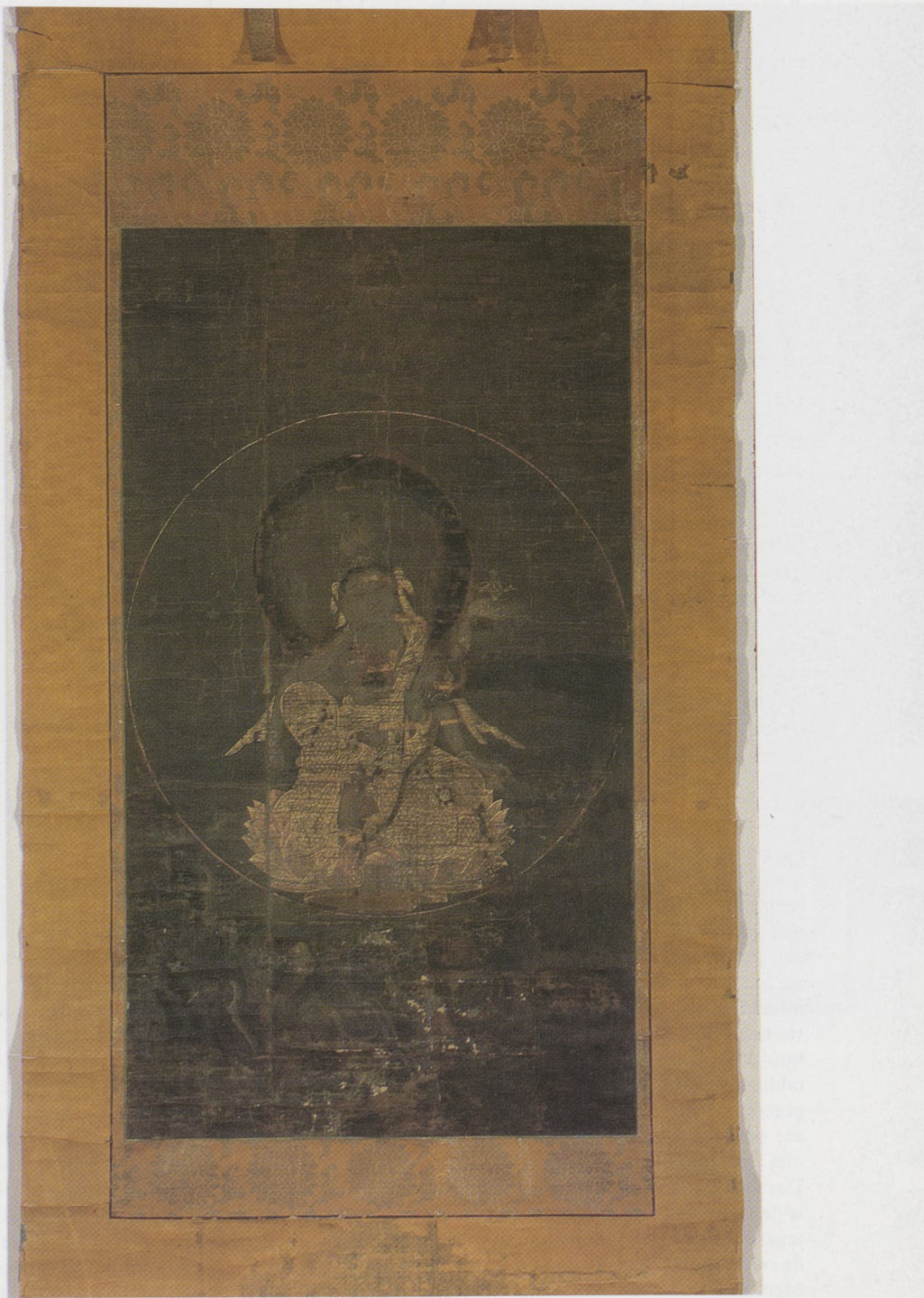
Afb. 4. Nyoirin Kannon, Japan, tweede kwart 14de eeuw. Rolschildering in inkt, kleuren en goud op zijde, 91 × 51,5 cm.