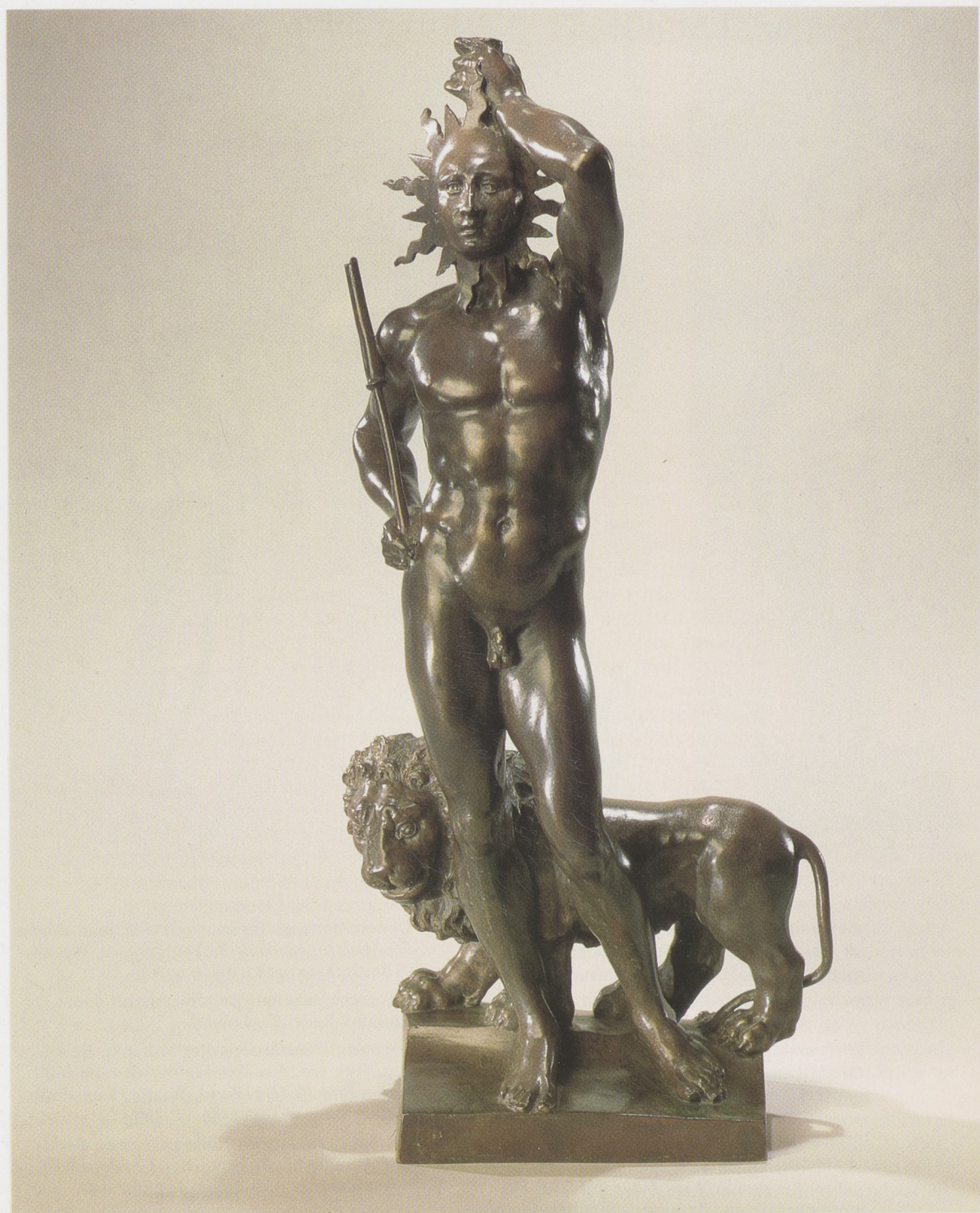
Afb. 15. J. G. van der Schardt, Sol , ca. 1580. Brons. h. 45,7 cm.