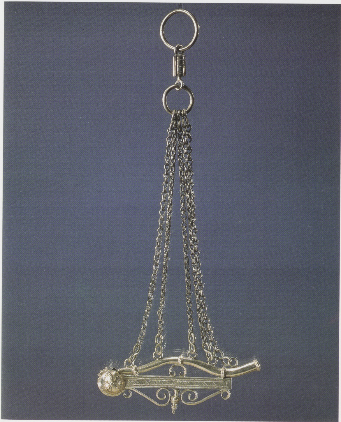
Afb. 18. Sifflet van zilver, Nederland (?), ca. 1600. H 12,5 cm