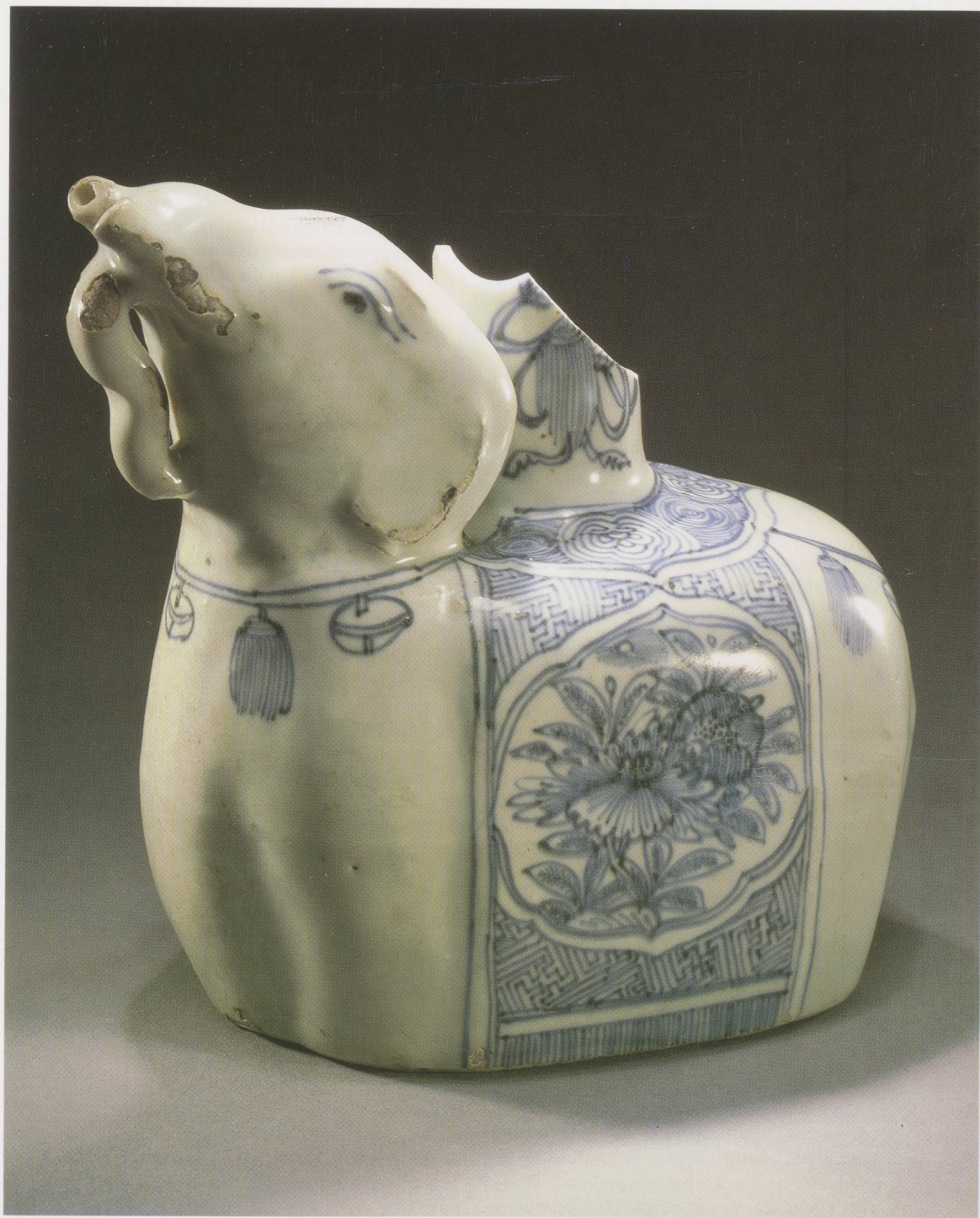
Afb. 19. Kendi in olifantsvorm, China, Wan-li, vóór 1613. Porselein, h. 17 cm.