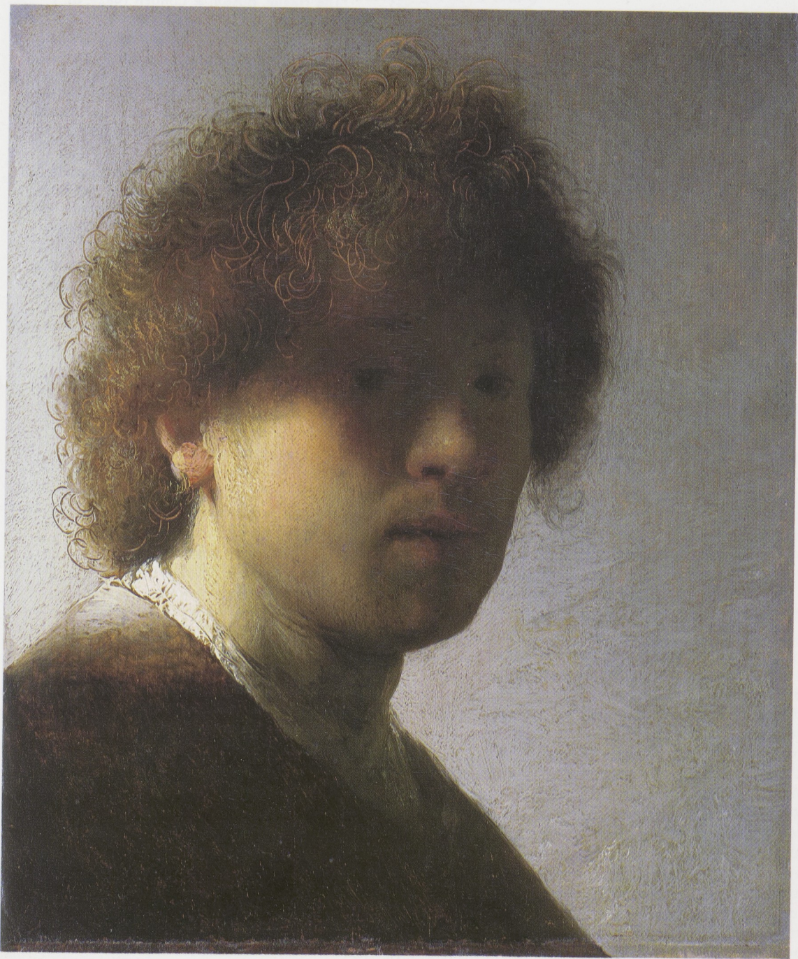
Afb. 24. Rembrandt, Zelfportret op jeugdige leeftijd, ca. 1628. Paneel, 22,5 × 18,6 cm.