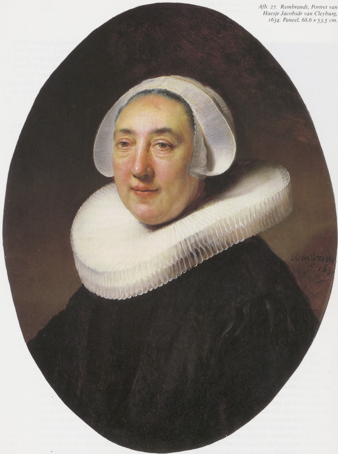
Afb. 27. Rembrandt, Portret van Haesje Jacobsdr van Cleyburg, 1634. Paneel, 68,6 × 53,5 cm.