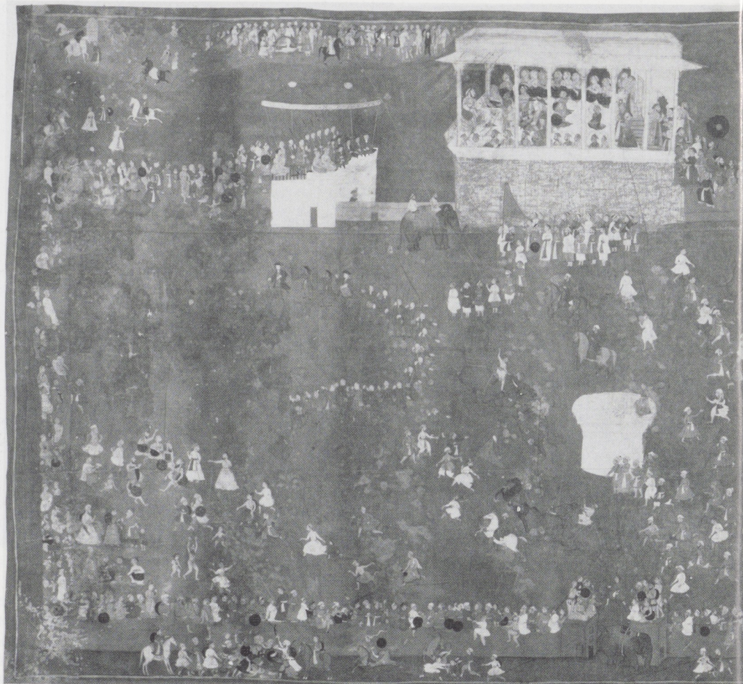
Afb. 35a. De doek in zijn geheel.

later bij de Groot-Mogol in Lahore aan. De langdurige onderhandelingen aan het hof werden afgebroken door de dood van Bahadur Shah. Ketelaar moest opnieuw beginnen bij zijn opvolger Jahandar Shah in Delhi. Pas in oktober 1712 kon het gezantschap de terugreis naar Surat te met de gevraagde concessiebrieven aanvaarden. Bij thuiskomst in februari 1713 vernamen ze, dat Jahandar Shah was afgezet. Hiermee waren hun brieven en de gehele onderneming waardeloos geworden.