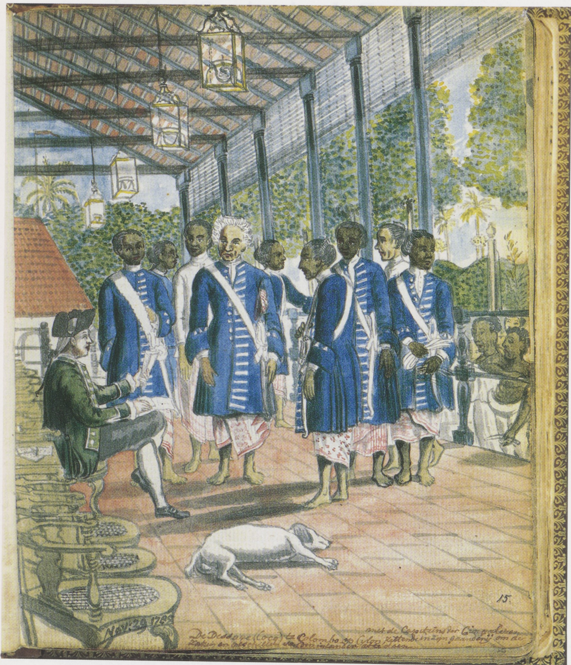
Afb. 38. Jan Brandes, De Landraad te Colombo, Ceylon 1785 . Penseel in kleur over schets in potlood, 195 × 150 mm. Schetsboek 1, p. 15.