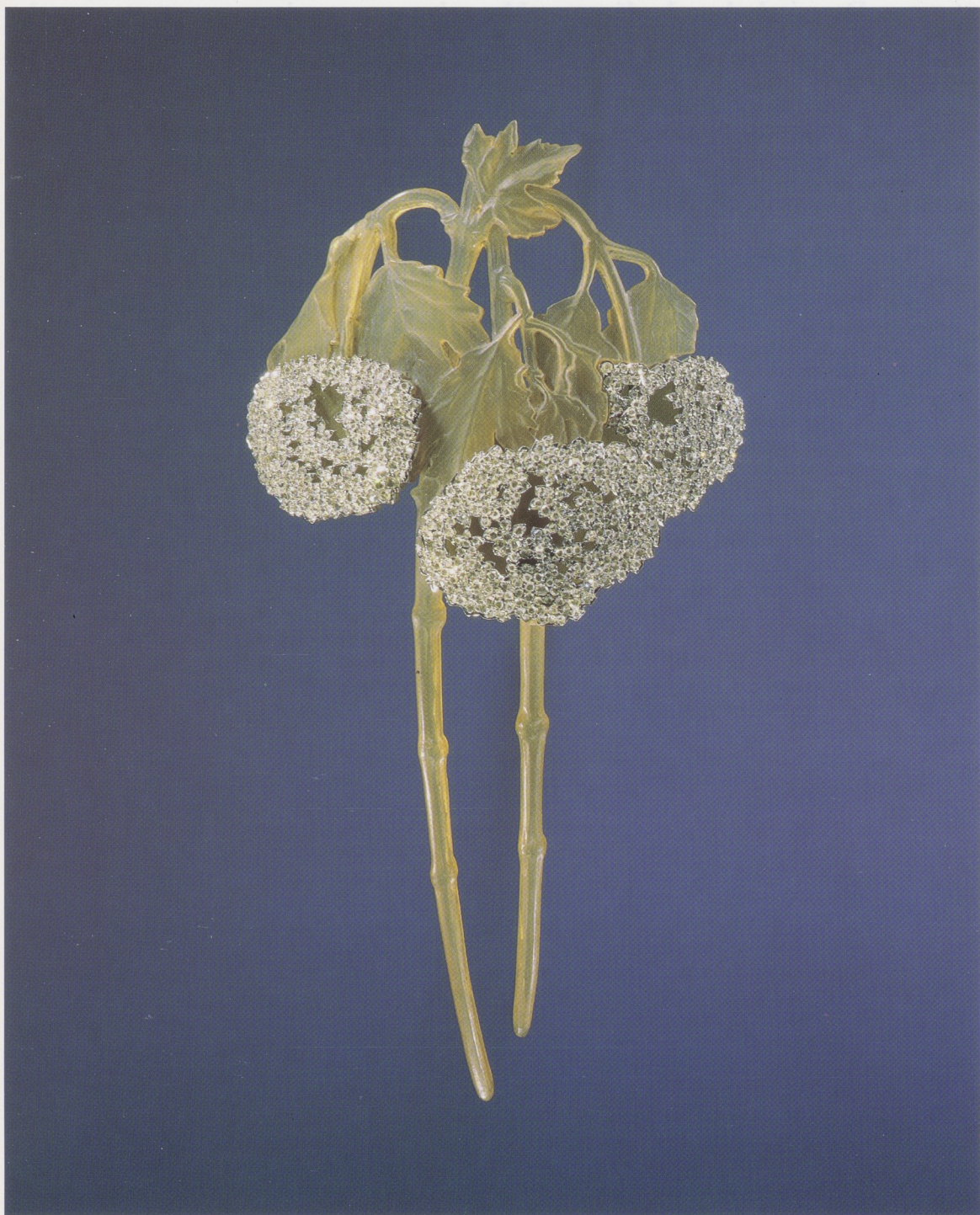
Afb. 44. René Jules Lalique, haarkam van hoorn met goud en diamantjes, Parijs, ca. 1902–1903. H. 15,5 cm, br. 7,6 cm.