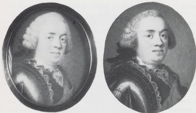
Afb. 2 (links). Onbekende kunstenaar, Willem IV, miniatuur op ivoor 45 × 40 mm. Stichting Historische Verzamelingen van het Huis Oranje-Nassau.

Liotard toegeschreven miniatuur een passend voorbeeld te vinden, waarnaar de kunstenaar kan hebben geschilderd. 23 De reeks grote portretten en de meestal daarnaar gestoken prenten bieden geen uitkomst. 24 Wel is er een type miniatuur dat als model gediend kan hebben. Een zodanig exemplaar bevindt zich in de Stichting Historische Verzamelingen van het Huis Oranje-Nassau (afb. 2) en een in het Rijksmuseum Paleis het Loo (afb. 3).